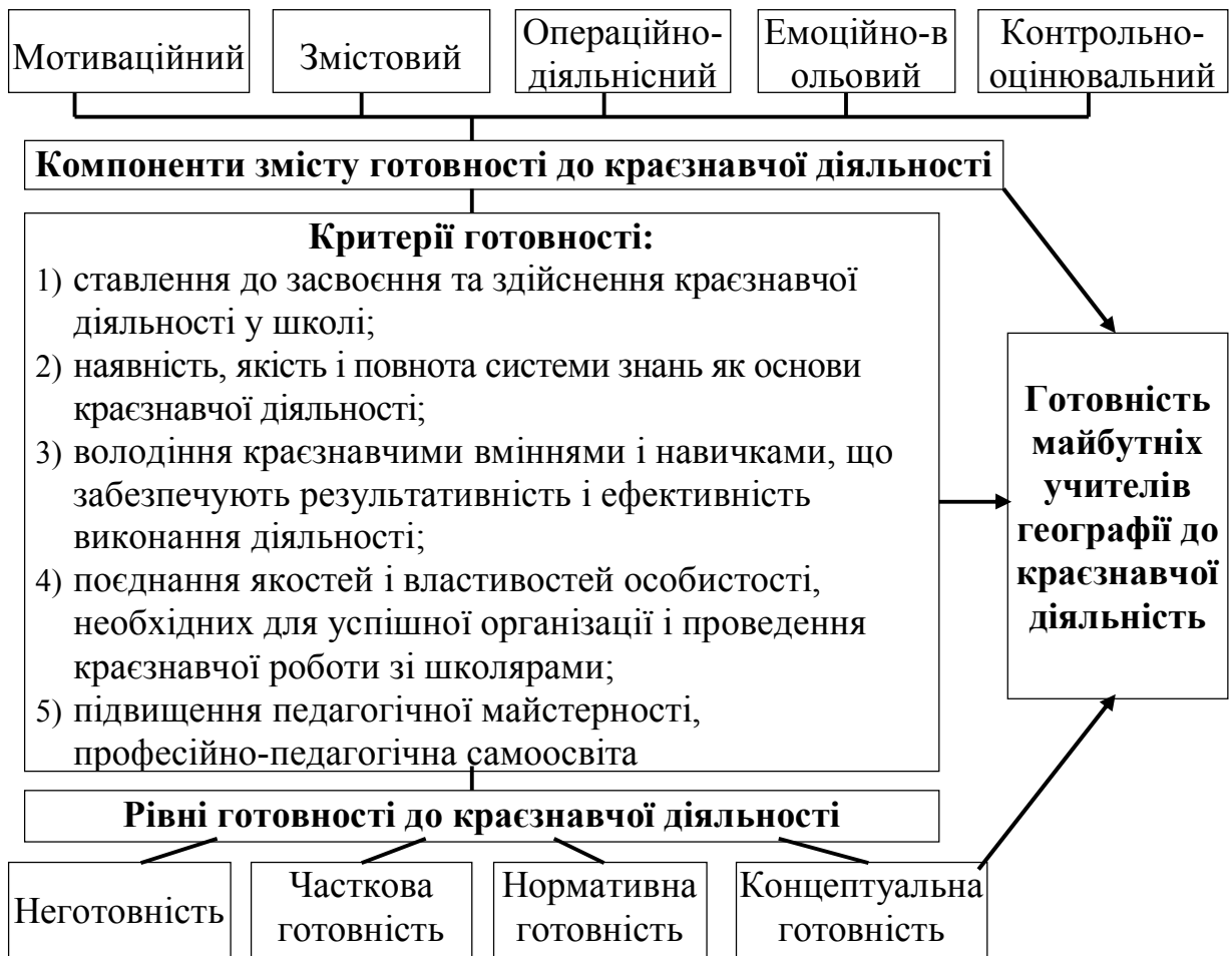
Рис. 1. Модель готовності майбутніх учителів географії до краєзнавчої діяльності

Теоретико-методологічні основи краєзнавчого дослідження міста як своєї малої Батьківщини закладали такі педагоги і науковці-географи, як М.М. Баранський, М.Г. Русаков, К.Ф. Строев, М.І. Федорак, Є.Й. Шипович. Загальнопедагогічні засади дослідження міста з позицій шкільного краєзнавства розроблялися на шпальтах науково-методичних збірок “Краєзнавство в школі”, “Географія в школі” (40-70-х рр. ХХ ст.) та “Методика викладання географії” (60-80-х рр.). Аналізу підлягав містознавчий компонент сучасної географічної освіти в досвіді роботи вітчизняних (В.М. Бойко, А.В. Гудзевич, Л.І. Зеленська, Р.Р. Коваленко, С.Г. Кобернік, Н.В. Муніч, Л. Б. Паламарчук) та зарубіжних (В.І. Аксельрод, Н.О. Верещагіна та О.Г. Захаров, А.В. Даринський, Д.П. Фінаров та О.Н. Любимова) педагогічних працівників. Водночас специфіка організації географічно-краєзнавчого дослідження міста і підготовка до цієї діяльності майбутніх учителів географії не були предметом наукових досліджень.