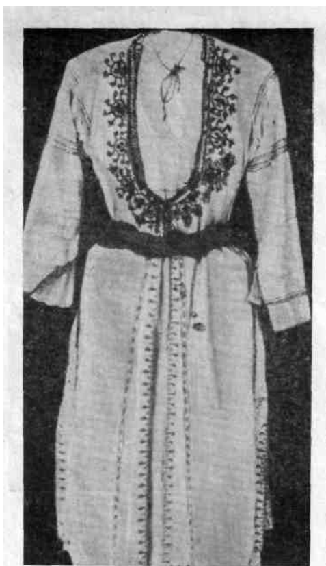
Рис. 3. «Сагиас» — национальная женская одежда, украшенная вышивкой

Национальная одежда киприотов в экспозиции музея занимает особое место. Ведь жители острова издавна уделяли одежде большое внимание, и недаром на Кипре говорят, что в одежде, в первую очередь в ее цвете, читается характер и темперамент киприотов. Экспонаты Музея народного искусства демонстрируют широкую гамму цвета, на первый взгляд непривычную и даже несколько резковатую для восприятия. Но достаточно взглянуть на полный женский костюм, как убеждаешься в гармонии всех его предметов. Чаще всего юбка или платье (желтого, красного, сиреневого цвета) сочетается с черным кафтаном, вышитым серебром. Считается, что приверженность киприотов к