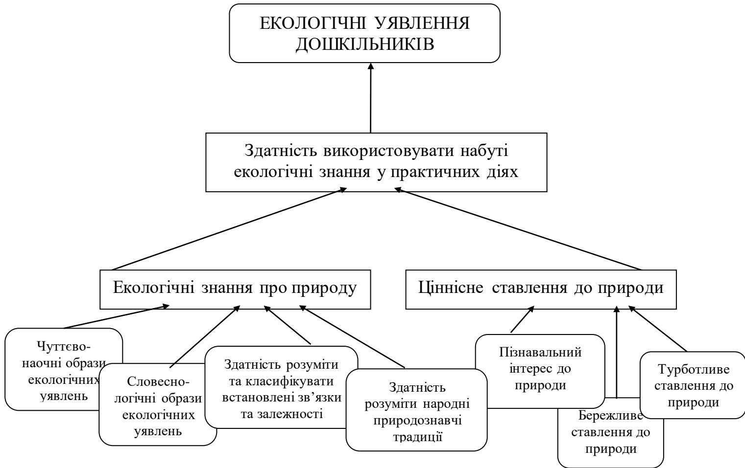
Рис. 1. Модель розвитку екологічних уявлень старших дошкільників

екологічні знання про об'єкти природи, ціннісне ставлення до них та здатність використовувати набуті знання у практичних діях (рис. 1).