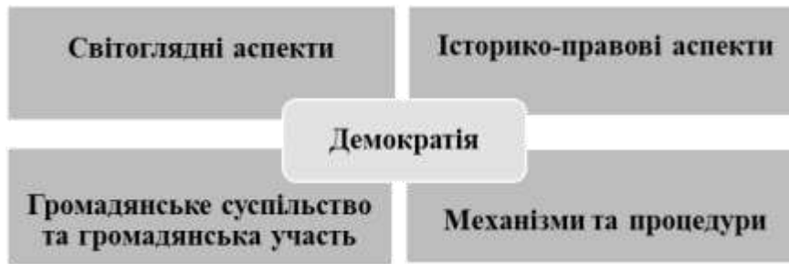
Рис. 2. Базова структура інтегрованого навчального курсу з демократії

проблеми. Оскільки українське суспільство переважно традиційне та ще не пододало патерналістських уявлень, то студенти на цьому етапі, як правило, або відчують розгубленість, або вважають, що всі проблеми вирішує президент.