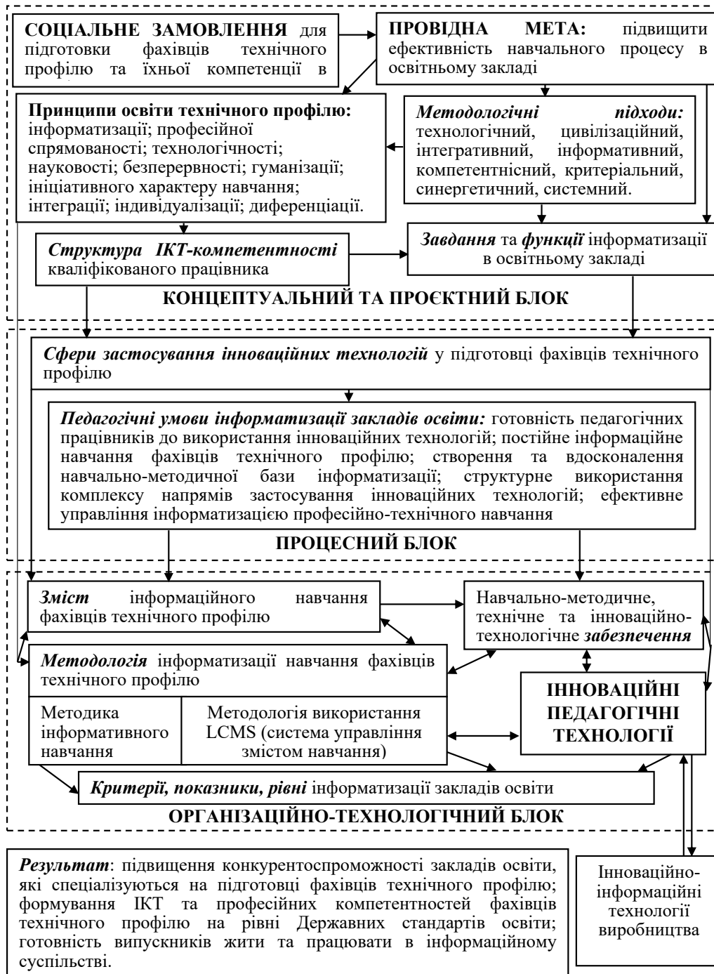
Рис. 4. Модель інформатизації освітнього процесу в підготовці фахівців технічного профілю