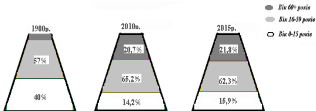
Рис. 1. Зміни у віковій структурі населення України

Щоб відповісти на питання, чому вирішення проблеми освіти людей поважного віку є важливим для країни , ми маємо спочатку звернути увагу на соціально-демографічний аспект. Щоб зрозуміти нашу стурбованість, давайте подивимося на діаграму змін у віковій структурі населення України, які відбулися за останні сто двадцять років (Мал. 1).