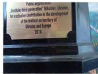
Громадській організації «Університет третього віку» Миколаїв, Україна, за значний внесок у розвиток фестивального руху на теренах України і Європи