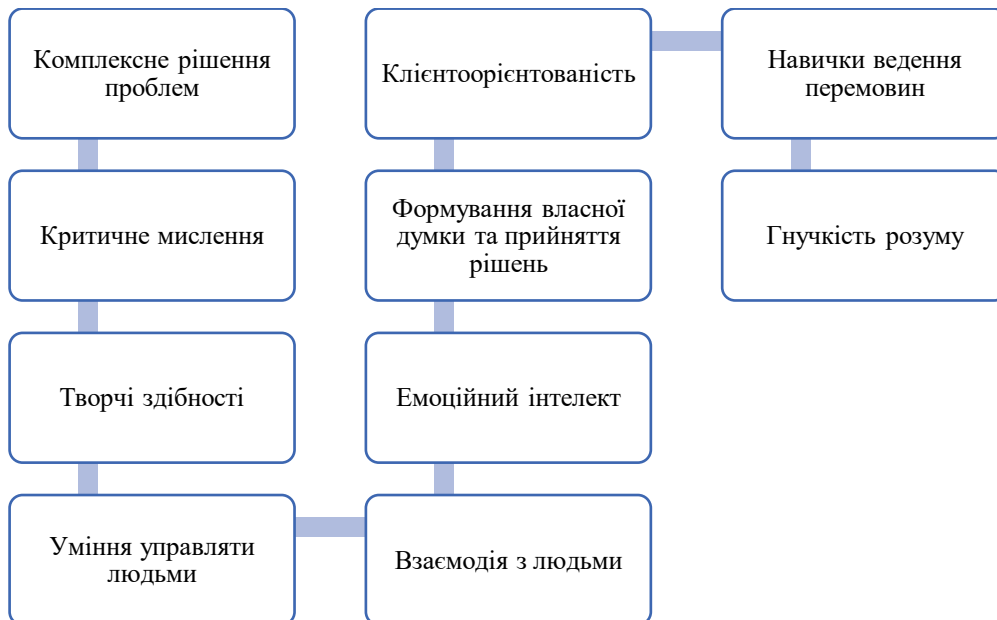
Рис. 3. Необхідні навички «soft skills» в управлінській діяльності керівника закладу дошкільної освіти

Щоб досягти успіху в управлінській діяльності, сучасному керівнику потрібно опанувати необхідними навички «soft skills».