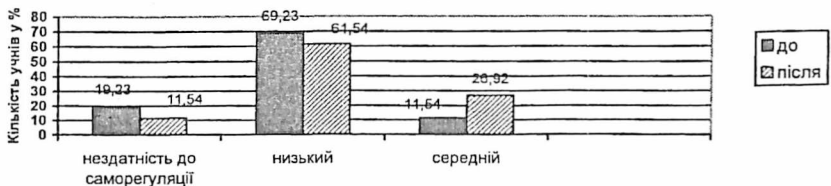
Рис. 2. Характеристика загальної саморегуляції прояву лінощів учнів експериментальних класів до і після формувального експерименту

Дані про зміни в загальній саморегуляції прояву лінощів подано на рис. 2.