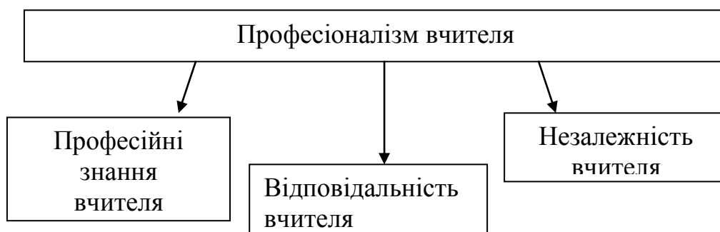
Рис. 2. Взаємозв'язок професіоналізму вчителя з його професійною відповідальністю

У статті Вільяма П.Данлепа "Мистецтво навчання" відзначається, що до процесу навчання залучаються, щонайменше, три головних компоненти: ті, хто навчається, зміст предмета як такого і теорія навчання, де кожна складова знаходиться в суворому збалансованому порядку. Педагоги, що володіють глибокими психолого-педагогічними та предметними знаннями, розвиненими творчими здібностями та професіоналізмом можуть претендувати на посаду Майстра.