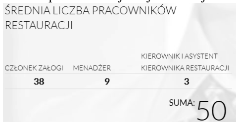
Wykres 1: Struktura pracownicza jednej restauracji