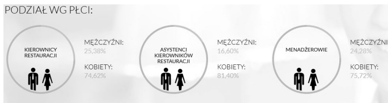
Wykres 2: Podział ze względu na płeć na wyższych poziomach struktury