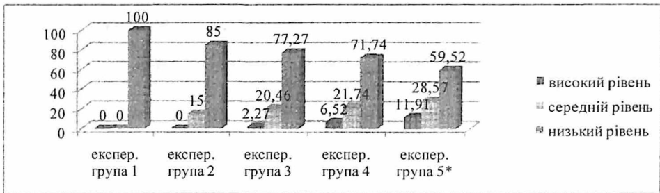
Рис. 1. Порівняльна характеристика рівнів психологічної готовності до професійної діяльності студентів-юристів у процесі фахової підготовки

На основі аналізу результатів дослідження сформованості окремих компонентів визначався загальний рівень сформованості психологічної готовності до професійної діяльності у майбутніх юристів (рис. 1).