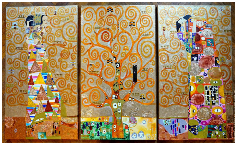
Картина "Дерево життя"