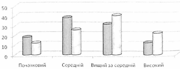
Рис. 3. Динаміка формування ціннісних компетенцій майбутніх учителів образотворчого мистецтва другої експериментальної групи