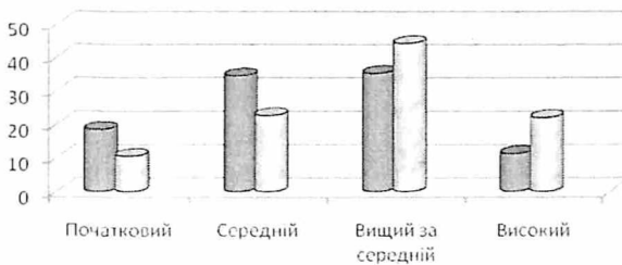
Рис. 2. Динаміка формування ціннісних компетенцій майбутніх учителів образотворчого мистецтва першої експериментальної групи

Діаграми рисунків 2-4 наочно відбивають динаміку формування ціннісних компетенцій майбутніх учителів образотворчого мистецтва контрольної та двох експериментальних груп.