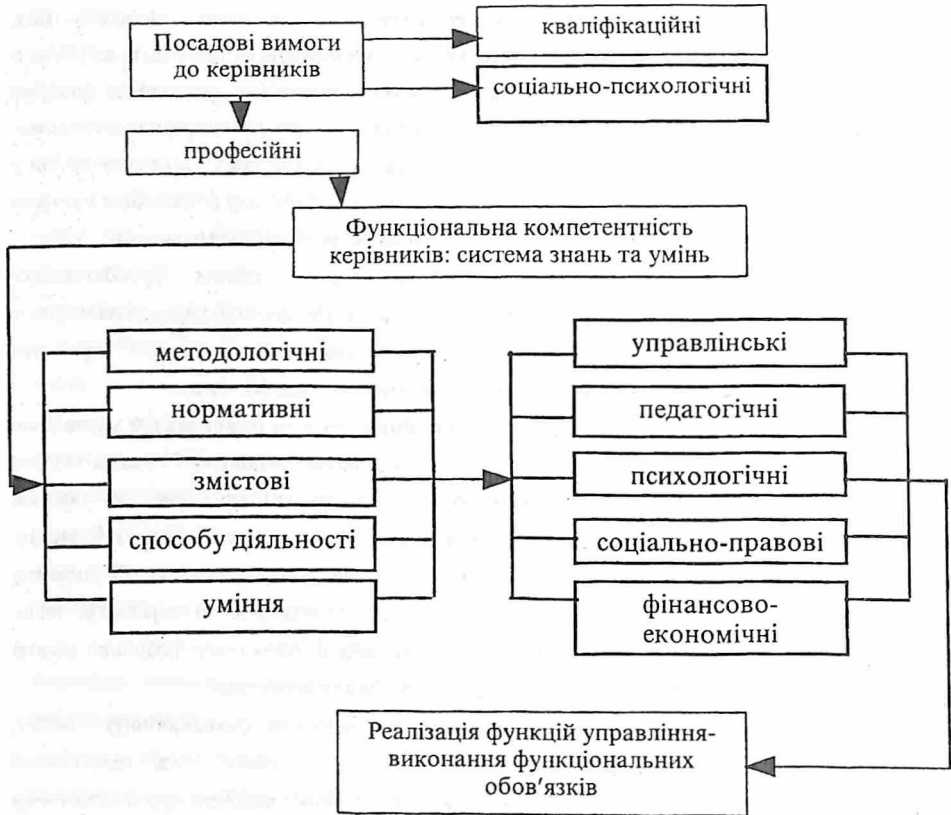
Рис. 1 Модель функціональної компетентності керівника

об'єднує людей, а відтак повинен знати основи психології менеджменту; в) об'єкт управління - школа - обумовлює необхідність оволодіння психолого-педагогічними знаннями та умінями; г) керівник школи може здійснювати управління тільки на підставі глибокої обізнаності в соціально-правовій сфері; д) директор навчального закладу забезпечує його функціонування та розвиток, виходячи із розуміння основних механізмів господарювання та фінансово-економічних знань.