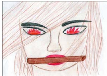
Рис. 3. Человек, которого я боюсь