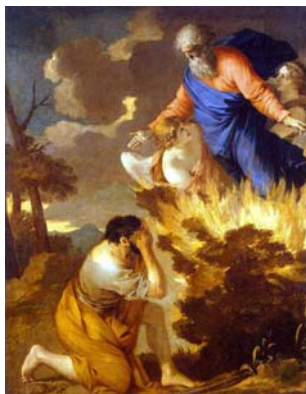
Рис. 1 Неопалимая Купина Автор Бурдон Себастьян

В религиозных традициях огонь ассоциируется с истиной и иллюзиями, составляющими духовного опыта. Зороастрийцы считали огонь источником сотворения мира, поэтому в каждом доме горел священный огонь, что ассоциировалось с благословением. Храм огня – это священное место для общины, куда ходят жрецы, поддерживающие пламя при помощи благовоний. Это пламя символизирует взаимодействие с Азурмаздой, повелителем мудрости [1].