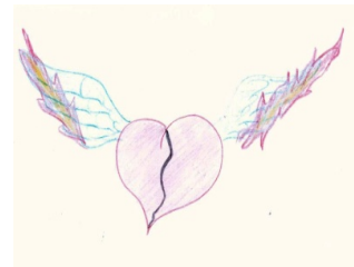
Рис. 7. Драматическое событие моей жизни