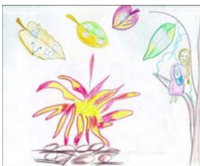
Рис. 5. Мое прошлое