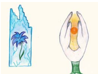
Рис. 8. Как меня видят