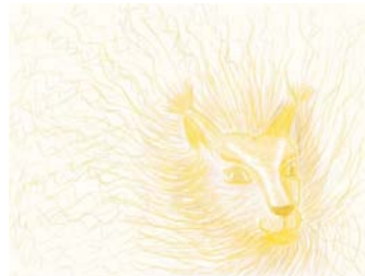
Рис. 6. Несуществующее животное