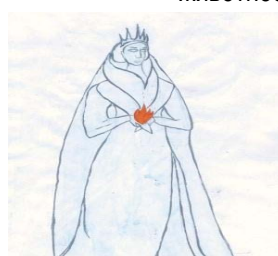
Рис. 9. Как меня видят в служебной ситуации