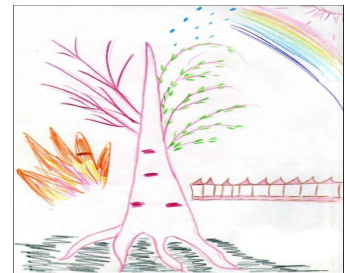
Рис. 4. Обычное психическое состояние близких мне людей