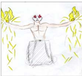
Рис. 2. Я иду на встречу беде

Исходя из психодинамической теории [9 – 11, 14], исследование основывалось на психоанализе неавторских рисунков и авторских, тематических психорисунков, в их комплексе, что позволило эксплицировать символ «огня» в его архетипическом содержании. Рисунки, позволяют констатировать факт изображения авторами (участниками АСПП) огня в следующем архетипическом содержании: энергия жизни, тенденция к смерти, муки и самобичевание, борьба, надежда, любовь, смерть и душевное бремя. Авторские рисунки часто используют символ «огня» в самых разных темах: «Я иду на встречу беде» (рис. 2), «Человек, которого я боюсь» (рис. 3), «Обычное психическое состояние близких мне людей» (рис. 4), «Мое прошлое» (рис. 5), «Несуществующее животное» (рис. 6), «Драматическое событие моей жизни» (рис. 7), «Как меня видят люди и как я вижу сама себя» (рис. 8), «Как меня видят в служебной ситуации» (рис. 9), «Восприятие несчастья» (рис. 10). Рисунки взяты из пособий Т. С. Яценко «Теория и практика глубинной психокоррекции», третья и шестая авторские школы (3, 6) [12; 13].