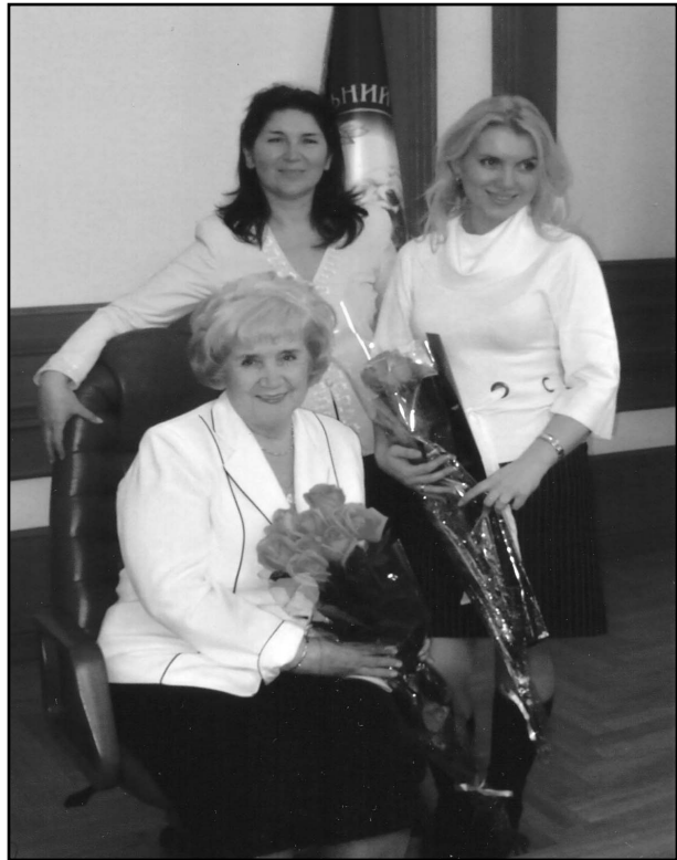
Підготувала надійну зміну

Недарма батьки й доля нагородили нашу славу ювілярку іменем Любов. Народжена й вихована в любові, вона примножує її своїми сьогоднішніми здобутками й майбутніми