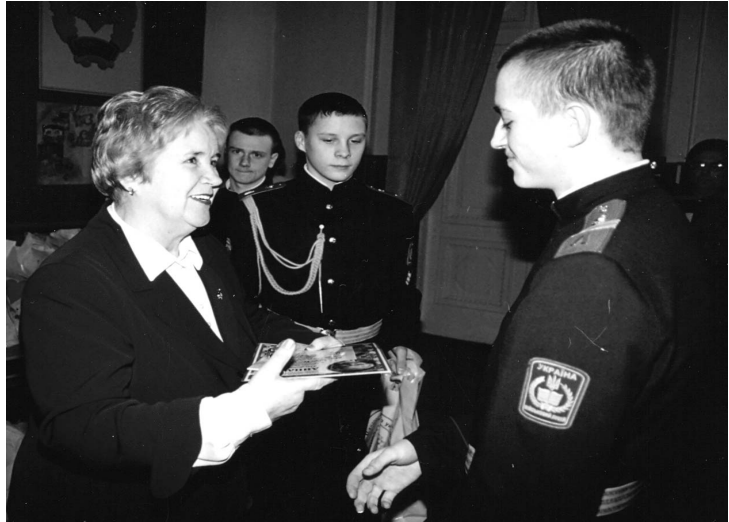
Нагородження переможців Міжнародного конкурсу знавців української мови імені Петра Яцика