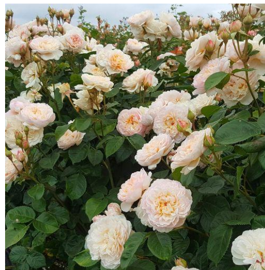
Fig. 18. Bouquet of roses. Fig. 19. Flowering rose. Fig. 20. English Shrub Rose Emily Brontë .