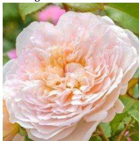
Fig. 17 The rose Emily Brontë (2018).