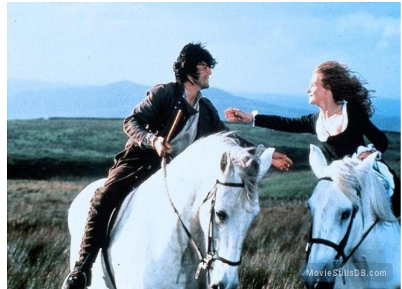
Fig. 7. Wuthering Heights (movie, 1992)

impact of the foundling Heathcliff on the two families of Earnshaw and Linton in a remote Yorkshire district at the end of the 18th century. Embittered by abuse and by the marriage of Cathy Earnshaw – who shares his stormy nature and whom he loves – to the gentle and prosperous Edgar Linton, Heathcliff plans a revenge on both families, extending into the second generation. Cathy's death in childbirth fails to set him free from his obsession with her, which persists until his death [24].