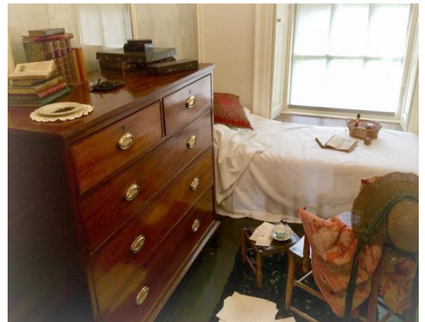
Fig. 4. Emily's room.