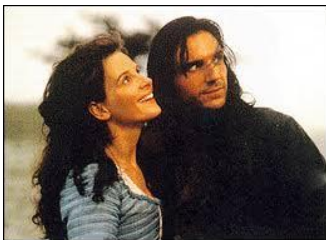
Fig. 11. Cathy Earnshaw and Heathcliff [26].

The Brontë Society asked to name this rose to celebrate the bicentenary of the birth of the novelist, Emily Brontë. Her much-loved novel, Wuthering Heights , was published in 1847, a year before her untimely death at the age of 30. It is a dark tale of passion and revenge, centred around the relationship between Cathy Earnshaw and Heathcliff [7] (Fig. 8, 11).