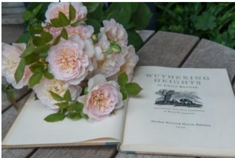
Fig. 1. Emily Brontë (1816–1855). Fig. 1. Rose "Emily Brontë" and Wuthering Heights.