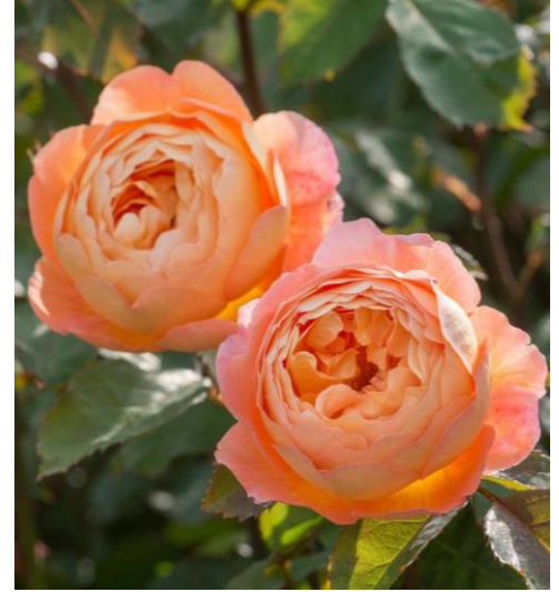
Fig. 13. Rose Dame Judi Dench . Fig. 14. Rose Emily Brontë . Fig. 15. Rose Lady Emma Hamilton