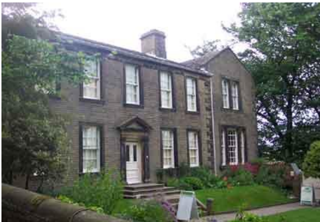
Fig. 3. The Brontë Pasonage Museum.

Emily Brontë , in full Emily Jane Brontë , pseudonym Ellis Bell , (born July 30, 1818, Thornton, Yorkshire, England – died December 19, 1848, Haworth, Yorkshire ( Fig. 3, 4 ), English novelist and poet who produced but one novel, Wuthering Heights (1847), a highly imaginative work of passion and hate set on the Yorkshire moors. Emily was perhaps the greatest of the three Brontë sisters ( Fig. 4 ), but the record of her life is extremely meagre, for she was silent and reserved and left no correspondence of interest, and her single novel darkens rather than solves the mystery of her spiritual existence [24].