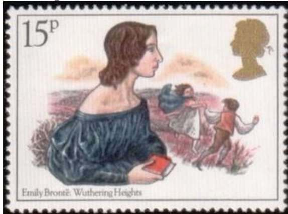
Fig. 6. Emily Brontë stamp.

The story is recounted by Lockwood, a disinterested party, whose narrative serves as the frame for a series of retrospective shorter narratives by Ellen Dean, a housekeeper. All concern the