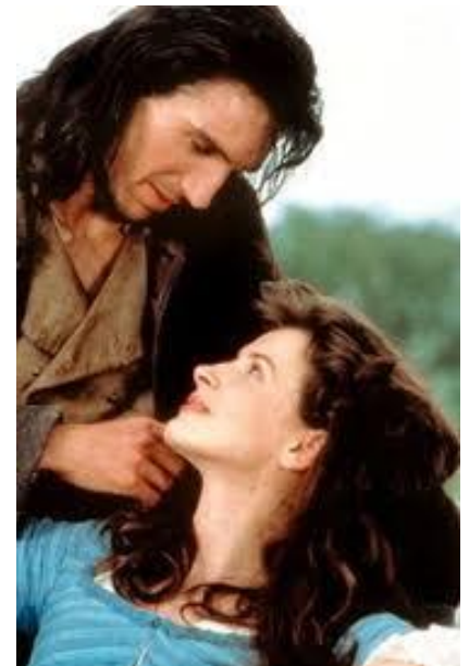
Fig. 8. Cathy Earnshaw and Heathcliff (movie, 1992) [26].

Emily Brontë's Wuthering Heights is a 1992 feature film adaptation of Emily Brontë's 1847 novel Wuthering Heights directed by Peter Kosminsky (movie [26]). This was Ralph Fiennes's film debut. This particular film is notable for including the oft-omitted second generation story of the children of Cathy, Hindley, and Heathcliff. The movie (Fig. 7, 8, 11) revolves around the lives of the Earnshaws and the Lintons. It portrays the role of suffering, revenge, and unrequited love in society.