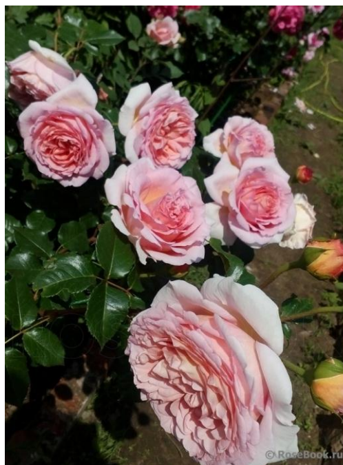
Fig. 12. Rosa 'Auscot'.