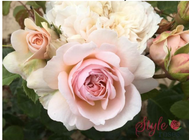
Fig. 9. Rose Emily Brontë . Fig. 10. English Shrub Rose Emily Brontë bred by David. Rosa 'Auscot' (Fig. 12). It produces big, cup-shaped, pink flowers. These flowers are attractively scented and appear from early summer. This plant is part of the English Shrub Rose Horticultural Group. The flowers of plants in this group have many petals and they may be single or double in structure and scented (video [2;5; 16]).

The Brontë Society asked to name this rose to celebrate the bicentenary of the birth of the novelist, Emily Brontë. Her much-loved novel, Wuthering Heights , was published in 1847, a year before her untimely death at the age of 30. It is a dark tale of passion and revenge, centred around the relationship between Cathy Earnshaw and Heathcliff [7] (Fig. 8, 11).