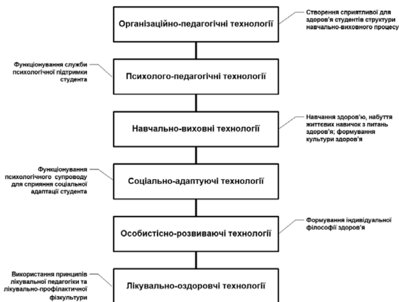
Рис. 1. Здоров'язберігаючі освітні технології

У контексті дослідження заслуговує на увагу підхід низки науковців