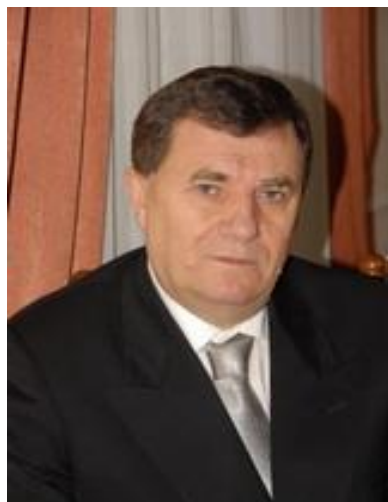
Євтух Володимир Борисович, доктор історичних наук, професор, член- кореспондент НАН України, заслужений діяч науки і техніки України, декан факультету соціально-економічної освіти Національного педагогічного університету імені М. П. Драгоманова