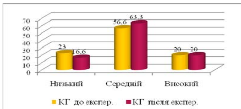
Рис. 2. Рівні самооцінки комунікативної компетентності до та після експерименту у контрольній групі

Більш детальний аналіз дозволив конкретизувати, які саме показники професійної комунікативної компетентності мали позитивну динаміку (табл. 2).