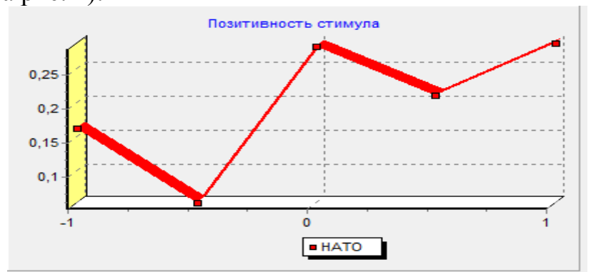
Рис. 2. Конотативна структура стимулу НАТО

– графіків (конотативна структура стимулу НАТО відображена на рис. 2, а динаміка конотативних компонентів стимулів ВИБОРИ і РЕФОРМА за період 2014 – 2016 р.р. – на рис. 3).