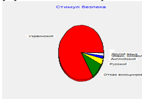
Рис. 1. Структура АП стимулу БЕЗПЕКА за мовами вираження асоціатів

– діаграм (розподіл асоціатів за критерієм їх мовного вираження в АП стимулу БЕЗПЕКА відображено на рис. 1):