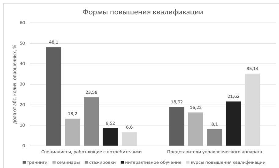
Рис. 2. Сравнительный анализ мнений респондентов относительно предпочитаемых форм повышения квалификации специалистов массового спорта

Респондентам было предложено проанализировать ряд форм повышения квалификации (рис. 2). Анализ результатов опроса позволил выявить как общие, предпочитаемые в большей или меньшей степени представителями основной части опрошенных, так и отдельные формы повышения квалификации, предпочтение которым отдали лишь определенные категории специалистов.