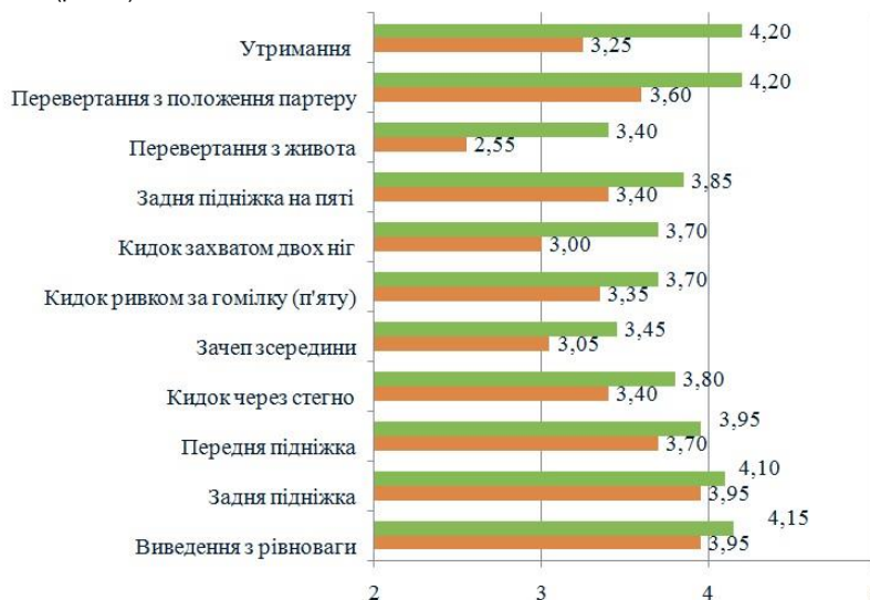
Рис. 2. Порівняльний аналіз технічної підготовленості самбістів експериментальної та контрольної групи (n=40):

Отримані дані педагогічного експерименту продемонстрували якісну перевагу в засвоєнні технічних дій самбістами експериментальної групи – середньостатистичний показник рівня засвоєння кожного прийому досліджуваних даної групи перевищує результат спортсменів контрольної групи: виведення з рівноваги на 5,1%, задня підніжка на 3,8% , передня підніжка на 6,8%, кидок через стегно на 11,8%, зачеп зсередини на 13,1%, кидок ривком за гомілку на 10,4%, кидок захватом двох ніг 23,3%, задня підніжка на п'яті на 13,2%, перевертання з живота на 33,3%, перевертання з положення партеру на 16,7%, утримання на 29,2% (рис. 2).