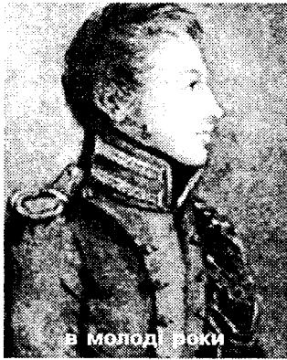
в молоді роки