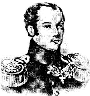
На чолі Південного товариства