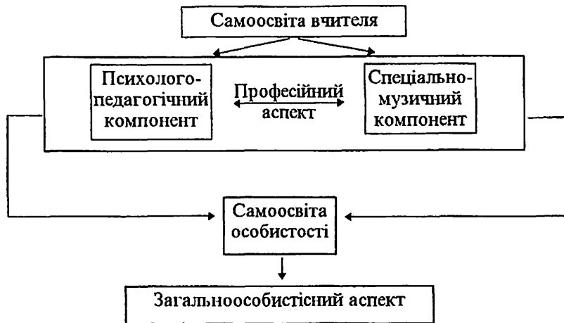
Рис. 1. Система самоосвіти вчителя початкових класів і музики

Оскільки проблема самоосвіти вчителя за своїм змістом є багатоплановою, її вивчення вимагало систематизації різноманітних аспектів самовдосконалення. Вивчення особливостей діяльності вчителя початкових класів і музики дозволило виділити принципи побудови системи самоосвіти (взаємозв'язок об'єктивного і суб'єктивного в удосконаленні особистості вчителя; єдність професійного і особистісного аспектів, реалізація творчої індивідуальності вчителя, спрямованість на професійну підготовку), її компонентний склад і системотворчу основу (рис. 1).