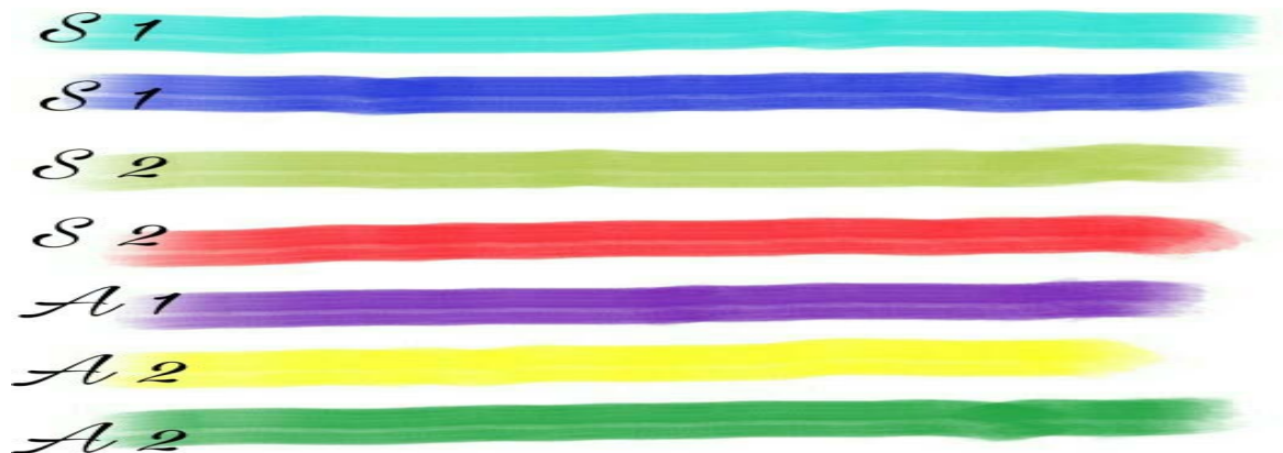
Рис. 1.1. Вигляд звуко-графічного рисунку вокально-хорового прийому «кластер».

спів. При цьому викладач підходить до дошки і диригентською паличкою вказує на будь-яку кольорову лінію, намальовану на дошці. Це означає, що в кластері відповідний звук повинен звучати голосніше ніж інші звуки. Співаючи, студенти повинні налагоджувати хорове ансамблеве звучання. Далі викладач пропонує навчальне завдання виконати іншим студентам навчального хору (рис. 1.1.).