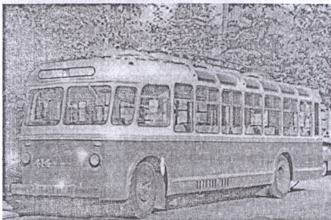
Тролейбус 1950-х рр.

— Намалюйте ваш улюблений вид транспорту.