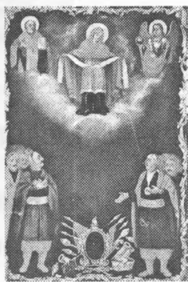
Б) Ікона козацька Покрова.