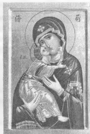
2. Ікона Вишгородської Богоматері.