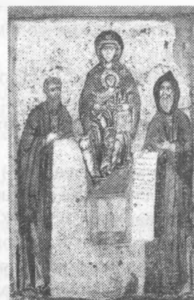
4. Богоматір Печерська зі Святими Антонієм та Феодосієм Печерськими.