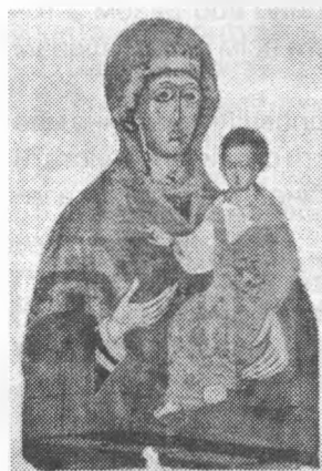
3. Ікона Богородиці Успенської церкви в Дорогобужі.