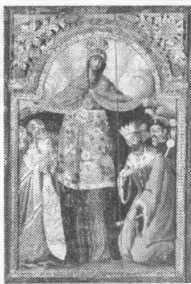
А) Ікона Покрови Богородиці.