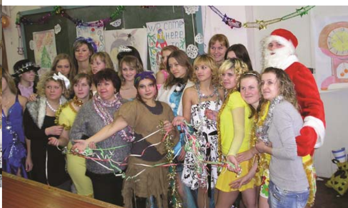
Фото на згадку