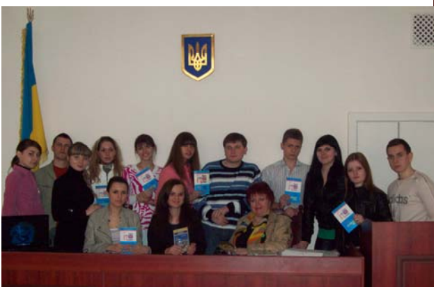
Блискучий випуск політологів, де кожен студент – яскрава, креативна особистість (2010, травень)