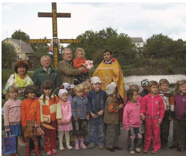
Акція «Господи, помилуй нас, збережи природу» (вересень 2008)