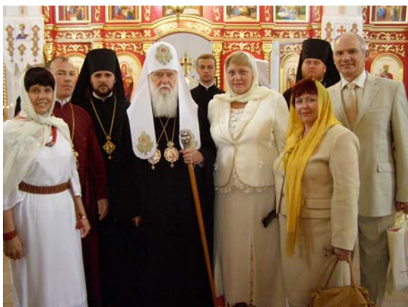
Патріарх Філарет на освяченні храму на честь Св.Володимира (30 травня 2009).