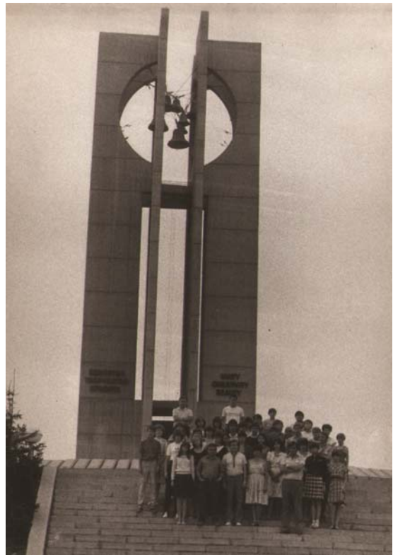
Болгарія. 10-Б біля самого великого Дзвону миру в Софії (липень 1985)