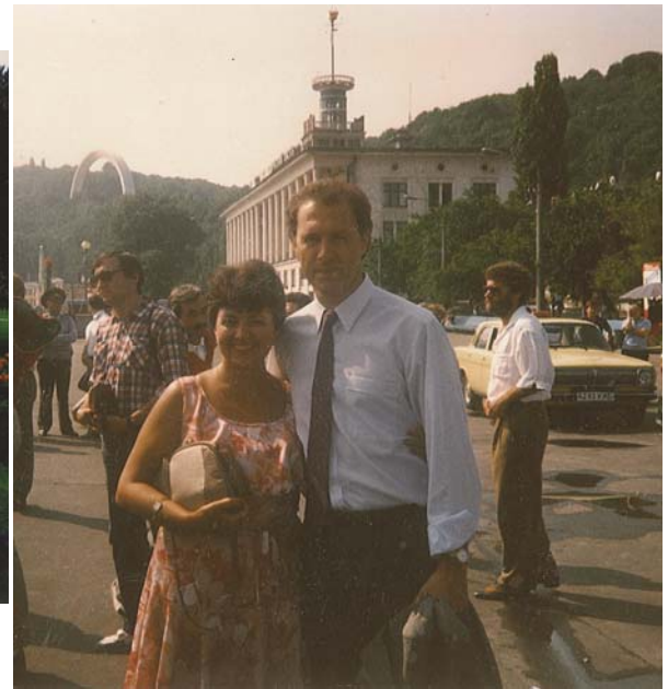
З легендою світового футболу Францем Беккенбауером (м. Київ, 1989)