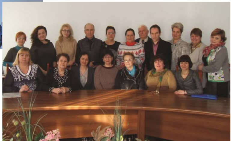
Спеціалізована вчена рада К 26.053.09 (м. Київ, 18 лютого 2016)