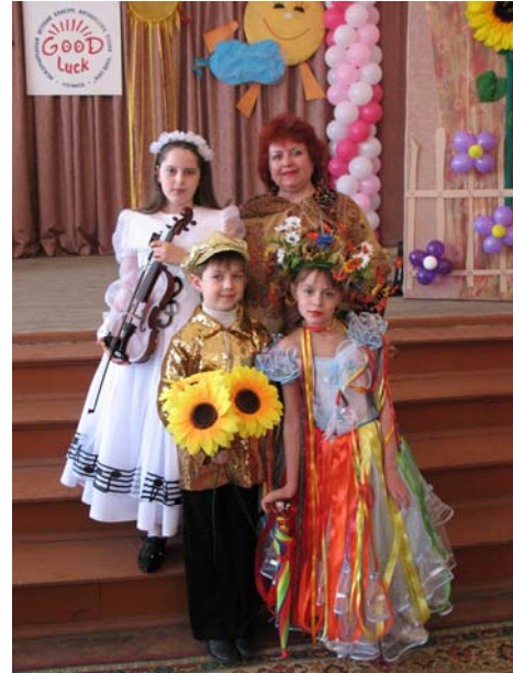
XIV Міжнародний дитячий конкурс з англійської мови. З конкурсантами з Білорусії та України і з академіком, заслуженим діячем культури України С.Белзою (м. Ногінськ, квітень 2009)