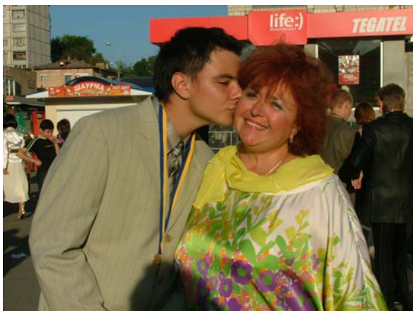
Поцілунок сина (червень 2008)