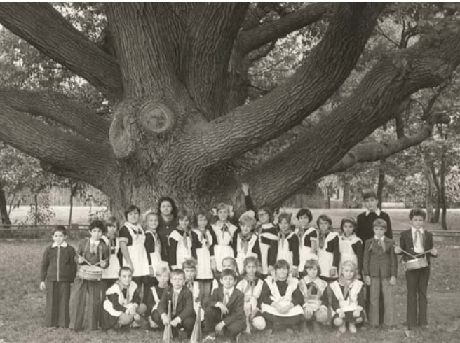
Біля козацького дуба. 4-Б клас на о. Хортиця (жовтень 1979)