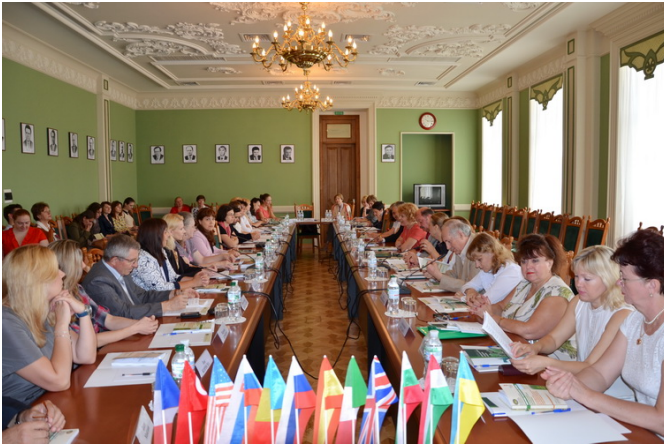
На Міжнародній науково-практичній конференції в дипломатичній академії України (м. Київ, 31 травня 2013)