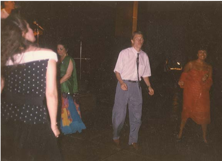
Банкет на честь прощального матчу Олега Блохіна (28 червня 1989)