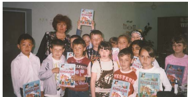
Учні-шестирічки (травень 2004 р.)