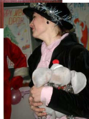
Чарівна Шапокляк із крискою Ларискою