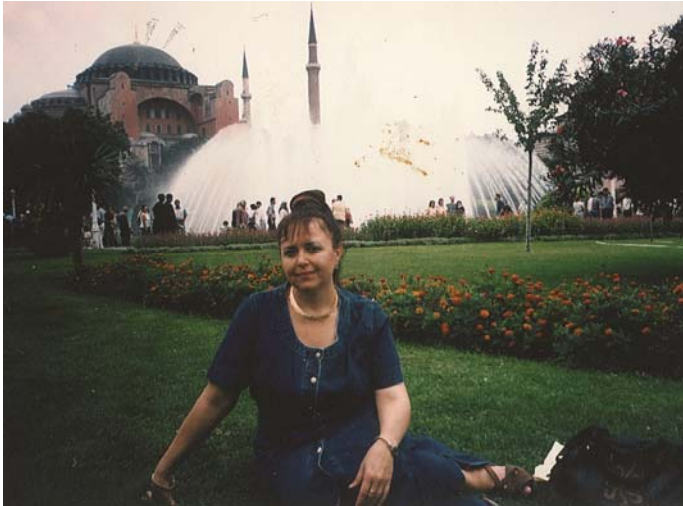
Свята Софія в Стамбулі (1998), але з часів Візантійської імперії