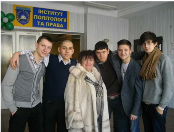
З майбутніми амбіційними правниками (квітень 2012)