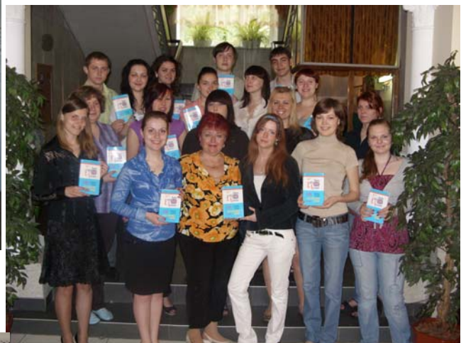
Життєрадісні, сонячні майбутні соціальні працівники (травень 2010)