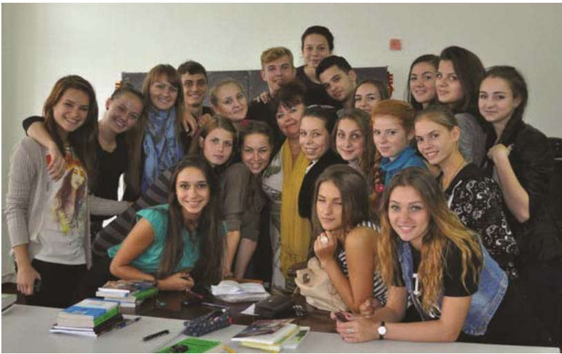
Мої незабутні, невгамовні хореографи (факультет мистецтв, травень 2012)