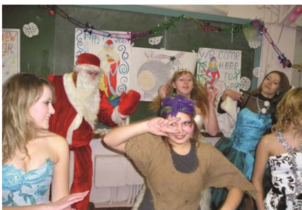
Чари Баби-Яги на успішну сесію