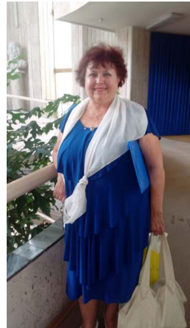
НБУ ім. В.І.Вернадського (м. Київ, серпень 2015)