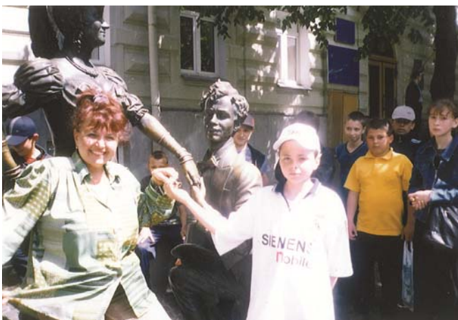
Андріївський узвіз. Експерсія з учнями (Київ, 2003 р.)