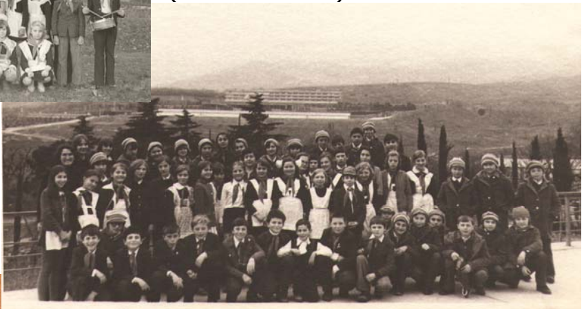
5-Б в Артеку (березень 1980)