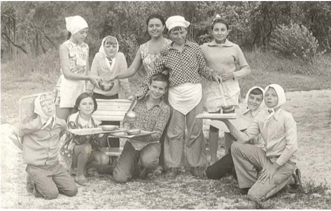
Педагогічна практика. Піонерський табір «Дельфін» (м. Скадовськ 1977). Наш загін чергує на кухні