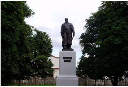
Рис. 7. Пам'ятник Богдану Хмельницькому (Білорусія, м.Гомель, 1958 р.)