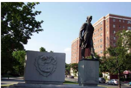
Рис. 2. Пам'ятник Т.Г. Шевченку (США, м. Вашингтон, район площі Дюпон-серкл, 27.06.1964)

Обніміться ж брати мої, Молю вас, благаю! [31, с. 334].