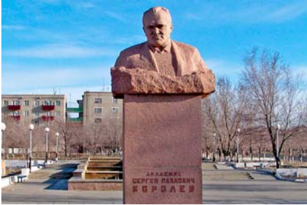
Рис. 8. Пам'ятник-погруддя Сергію Павловичу Корольову (Казахстан, м. Байконур).