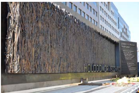
Рис. 4. Памятник жертвам Голодомору в Україні 1932–1933 рр.(США, м. Вашингтон, 7.11.2015)