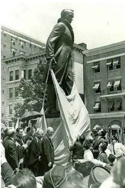
Рис. 1. Відкриття пам'ятника Шевченку у Вашингтоні

інших музеїв. У світі налічується 1384 пам'ятники Т.Г. Шевченку (у 35 країнах, з них 1256 – на території України). У зарубіжних країнах налічується 128 пам'ятників Тарасу Шевченку – у 35 країнах. Найбільше їх встановлено в Росії (10 пам'ятників та 20 меморіальних дощок), США (9), Канаді (9), Білорусі (6), Польщі (5), Молдові (4). По 3 пам'ятники зведено в Аргентині, Бразилії, Грузії, Узбекистані, Франції [3, с. 6], автори також надали фотографії цих пам'ятників.