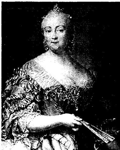
Імператриця Елизавета Петрівна