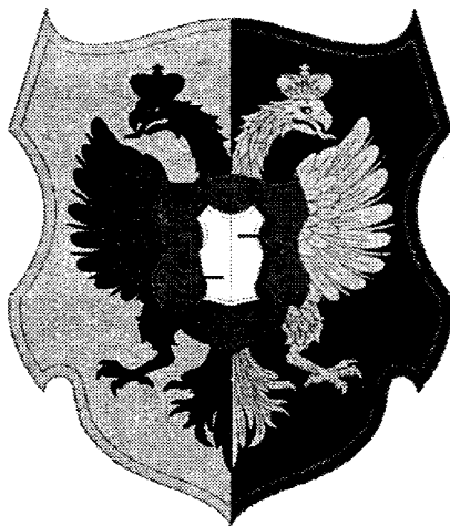
Фамільний герб К.Розумовського