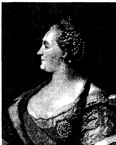
Імператриця Катерина II

— Кирило Розумовський дбав лише за свої особисті, корисливі інтереси. Виконуючи бажання численних родичів, гетьман на підставі своїх універсалів (без царських указів) почав роздавати їм у володіння не лише окремі маєтності, але й цілі сотенні містечка з вільним населенням. Так, за ревізією 1751 р., із вільних маєтностей в усіх полках нараховувалося 2 859 дворів і 26 бездвірних хат, в 1753 р. — відповідно 1 723 і 1 852, в 1764 р. — 963 і 367. Певна доля цих маєтностей дісталася й грузинським феодалам, які проживали в той час в Україні.