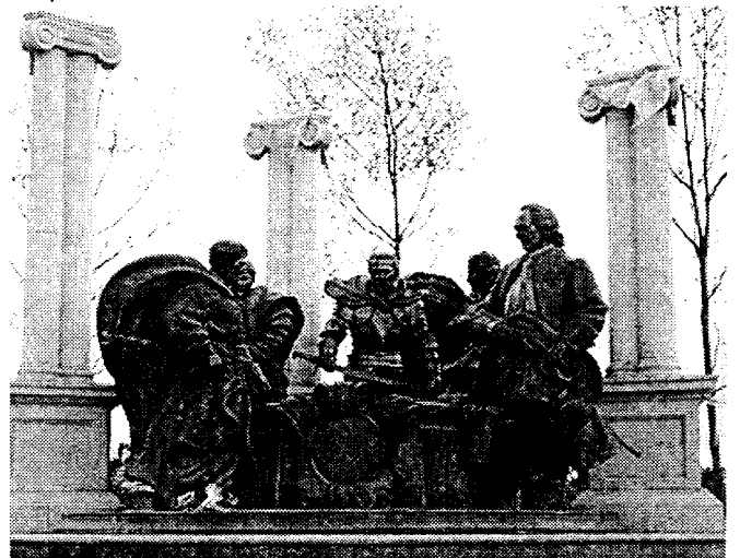
Меморіал Гетьманської слави в Батурині. Праворуч — К. Розумовський

3. Підготуйте ессе на тему: «Кирило Розумовський — український козак, що ухопив фортуна за чуба й тримав її».