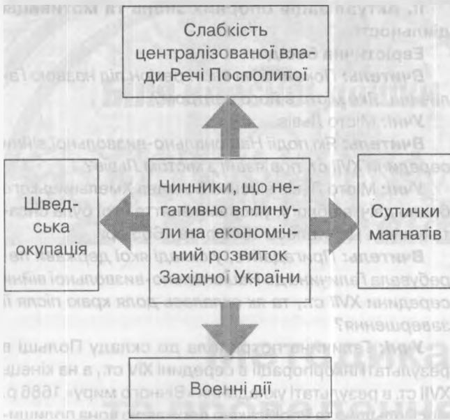
Структурна схема: «Чинники господарського розвитку Західної України перша половина XVIII ст.»

Б. Хмельницького. Край був охоплений активним національно-визвольним рухом. Проте виведення гетьманом своїх угруповань із західного регіону надовго відірвало Галичину від тих історичних процесів, які відбувались в Наддніпрянщині, і це дуже ослабило справу українства.