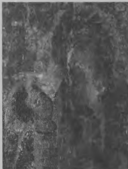
1. Ікона Божої Матері Холмської - найдавніша Візантійська ікона