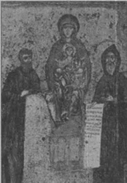
4. Богоматір Печерська зі Святими Антонієм та Феодосієм Печерськими