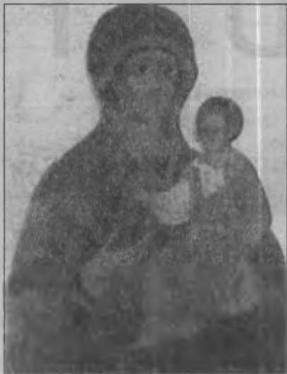
3. Ікона Богородиці Успенської церкви в Дорогобужі