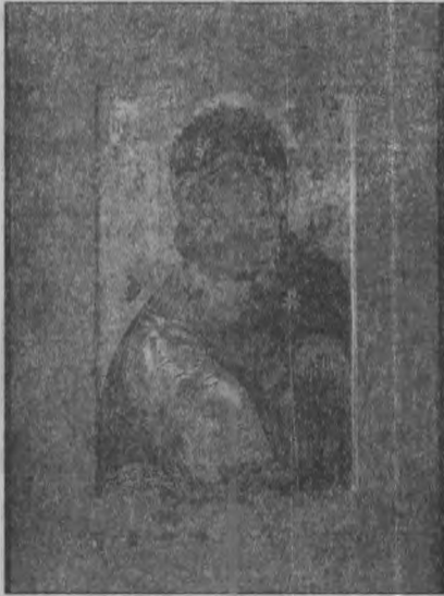
2. Ікона Вишгородської Богоматері