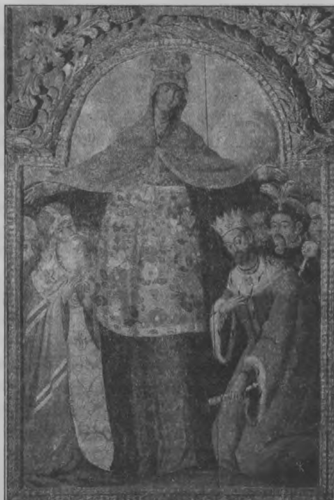
А) Ікона Покрови Богородиці

Капітани кожної команди мають з'ясувати, яких діячів зображено на іконах, та скласти панегірик їх діянням: «Славні ратними ділами».