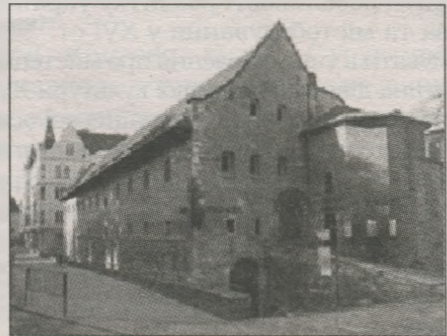
Львівський арсенал 1575 р.

У Львові XVI ст. проводяться значні фортифікаційні роботи, старі високі вежі-донжони із середньовічними гостроверхими шпильями, які, немов велетні, захищали місто впродовж століть починають ремонтувати. Округлий фундамент веж та велика кількість ширококутних бійниць знову забезпечують безпеку міста Лева. Після пожежі в 1574–1575 рр. відбудовують і міський арсенал. Він являв собою широку прямокутну споруду із високими та товстими стінами, а також масивними склепіннями. Для підвищення обороноздатності споруди вікон майже не було, а вхідні ворота зачинялися на декілька велетенських замків.