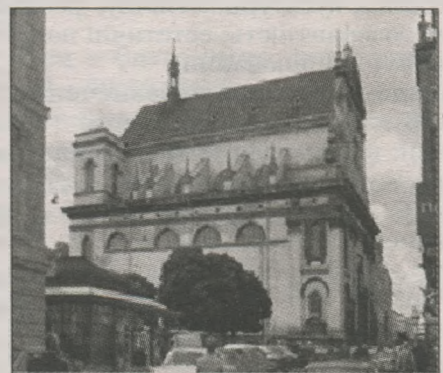
Єзуїтський костел 1610–1630 рр.