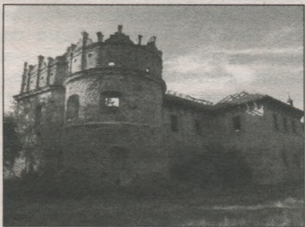
Замок Острозьких 1571 р.

Надзвичайно цікавою пам'яткою містобудування та архітектурного мистецтва є замок у Кам'янці-Подільському, який будувався протягом XIV–XVI ст. Найбільш ґрунтовні роботи по будівництву і перебудові окремих елементів замку здійснив архітектор Іов Претвич у середині XVI ст. Замість ветхих і тонких зубців він вмурував більш могутні, розширив подвір'я в напрямку мосту на р. Смотрич, вставив у башти багато нових біло-кам'яних одвірків з різьбою. Так, замок був не лише оборонною спорудою, а й витвором мистецтва. Цікаво, що замок будували майстри різних епох, але він зберігає композиційну і стилістичну єдність. Мистецтвознавці стверджують, що в Україні немає іншої подібної оборонної споруди, яка так гармонійно вписувалася б у ландшафт і була такою співвідносною зі скелястою горою. Мури і башти замку є ніби продовженням скель, на яких вони стоять.