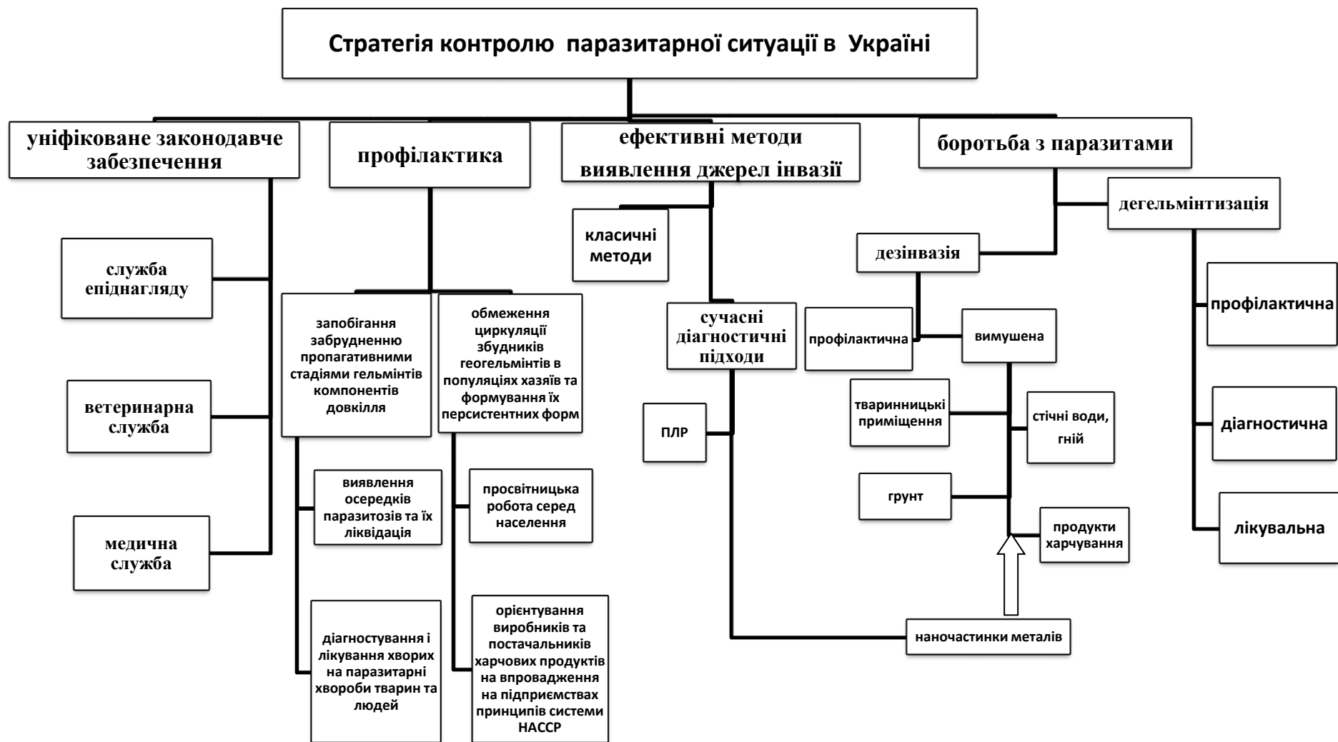
Рис. 2. Стратегія охорони довкілля від паразитарного забруднення