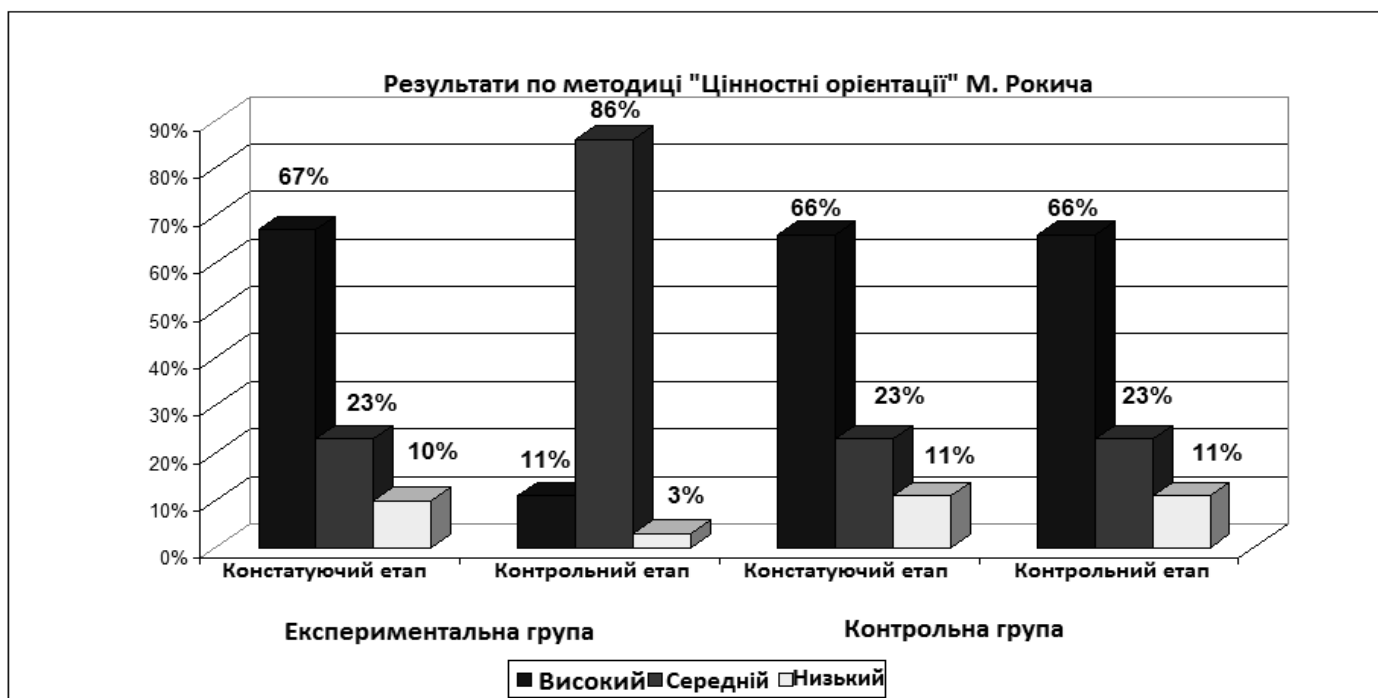
Рисунок 1 Результати рівня ціннісних орієнтацій за методикою «Ціннісні орієнтації» М. Рокича у контрольній та експериментальній групах на констатуючому та контрольному етапах

На основі результатів, отриманих у ході контрольного етапу дослідження, можна зробити висновок, що в розумово відсталих підлітків контрольної групи як і раніше завищені як термінальні цінності, так і інструментальні, а у розумово відсталих підлітків експериментальної групи ці цінності в ході цілеспрямованої корекційно-розвиткової роботи (формуючого етапу емпіричного дослідження) були переглянуті і тепер оцінюються адекватно своїм силам та можливостям. Із наведеної діаграми видно, що як і раніше у контрольній групі практично всі діти хочуть усе й відразу. Ціннісні орієнтації розумово відсталих підлітків дуже завищені, вони хочуть мати хорошу роботу та хорошу заробітну плату і при цьому нічого не робити.