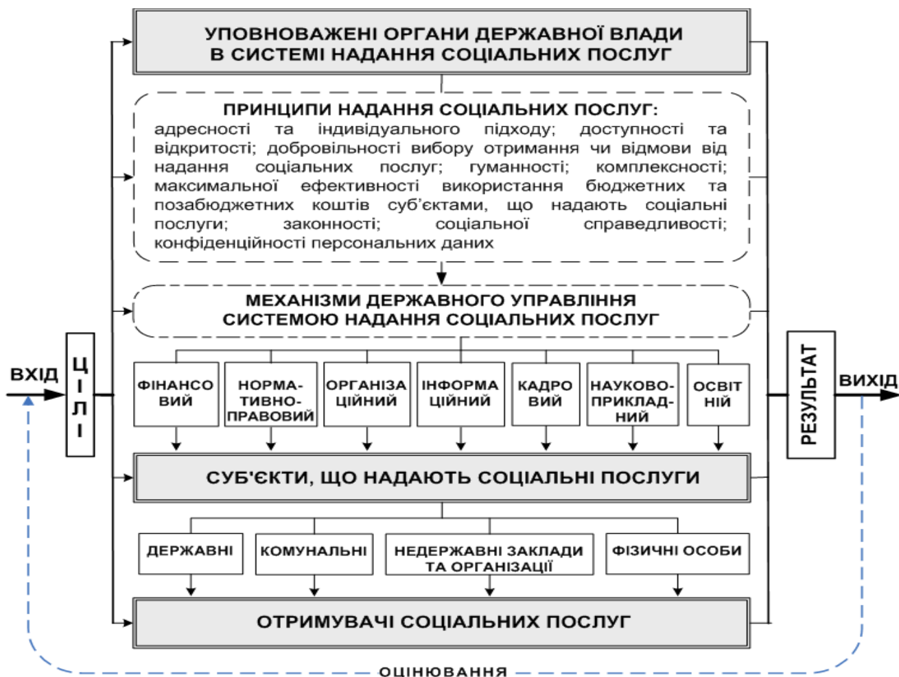
Рис. 1. Інтегральний механізм державного управління системою надання соціальних послуг

У процесі дослідження обґрунтовано потребу у висвітленні історичних передумов розвитку механізмів державного управління системою надання соціальних послуг, а також у тому, що систему надання соціальних послуг, механізми державного управління цією системою слід розглядати у взаємозв’язку подій минулого, сучасного та майбутнього. Підхід до дослідження, що базується на органічній єдності цих трьох складових, дає змогу виявити помилки, припущені в минулому, та запобігти їх виникненню у майбутньому, впровадити в державно-управлінську практику кращі історичний досвід і напрацювання. Пошук шляхів трансформування системи надання соціальних послуг, розроблення сучасних механізмів державного управління такими послугами мають базуватися на результатах дослідження історичних обставин, реалій, у яких вона колись функціонувала.