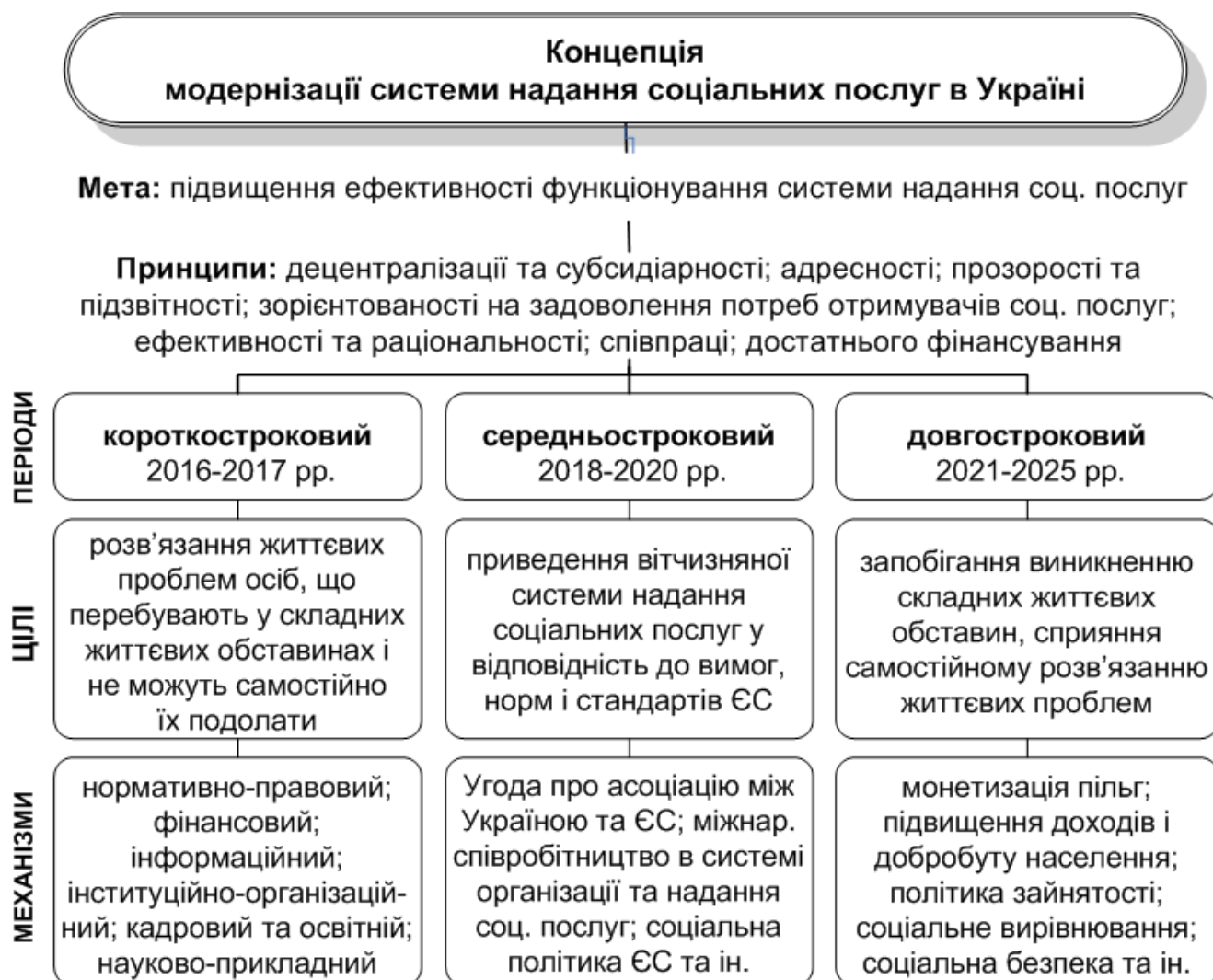
Рис. 3. Матриця Концепції модернізації системи надання соціальних послуг

Наголошено на тому, що основою вдосконалення механізмів державного управління системою надання соціальних послуг є Концепція модернізації системи надання соціальних послуг, яку розроблено з використанням результатів дослідження дисертації. До складу Концепції входять такі елементи (рис. 3): мета; принципи; періоди; цілі (пріоритети, завдання); державно-управлінські механізми.