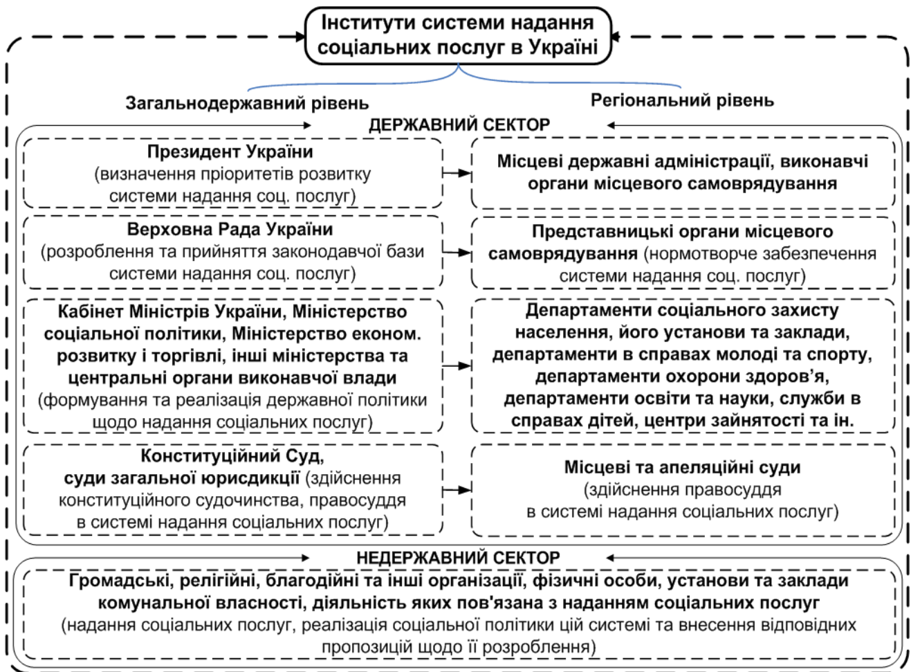
Рис. 2. Інтегральні функції інститутів в організаційному механізмі державного управління системою надання соціальних послуг

чинним українським законодавством, а органи державної влади не проявляють активності у співпраці з такими організаціями.