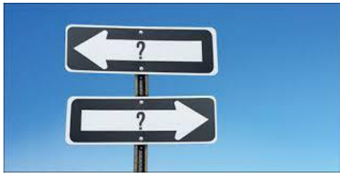
Мал. 1. “Stay or go...”