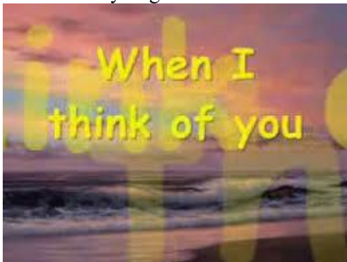
Мал. 3. “When I think of ...”