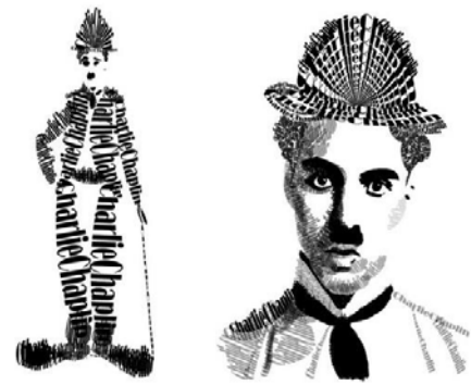
Рис. 3. Чарлі Чаплін

Ускладнемо завдання: 1) Спробуйте зобразити всю музичну групу (англійську, американську та ін.), використовуючи для цього тексти їхніх пісень (Роллінг Стоун, Битлз). 2) Зобразіть акторів у сцені з відомого фільму. 3) Відтворіть історичну подію з масою учасників [14, с. 104].