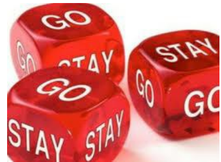
Мал. 2. “Stay or go...”