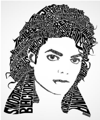
Рис. 1. Майкл Джексон

допомоги комп'ютера створить його портрет із фраз, висловлених ним (мал. 1–3). Наприклад: 1) The greatest education in the world is watching the masters at work (Michael Jackson) 2) We know what we are, but know not what we may be. 3) Better three hours too soon than a minute too late (William Shakespeare). 4) A day without laughter is a day wasted (Charlie Chaplin) [25].