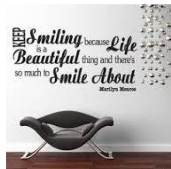
Мал. 6. “There's so much beauty”.

Завдання 5. Виберіть відому людину, якій ви симпатизуєте. Потім вручну або за