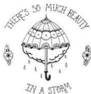
Мал. 5 “There's so much beauty”.

Далі продемонструємо можливу інтерпретацію художниками і дизайнерами фрази «There's so much beauty» («Там так багато краси») на мал. 5–6.