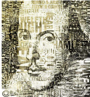
Рис. 2. В.Шекспір