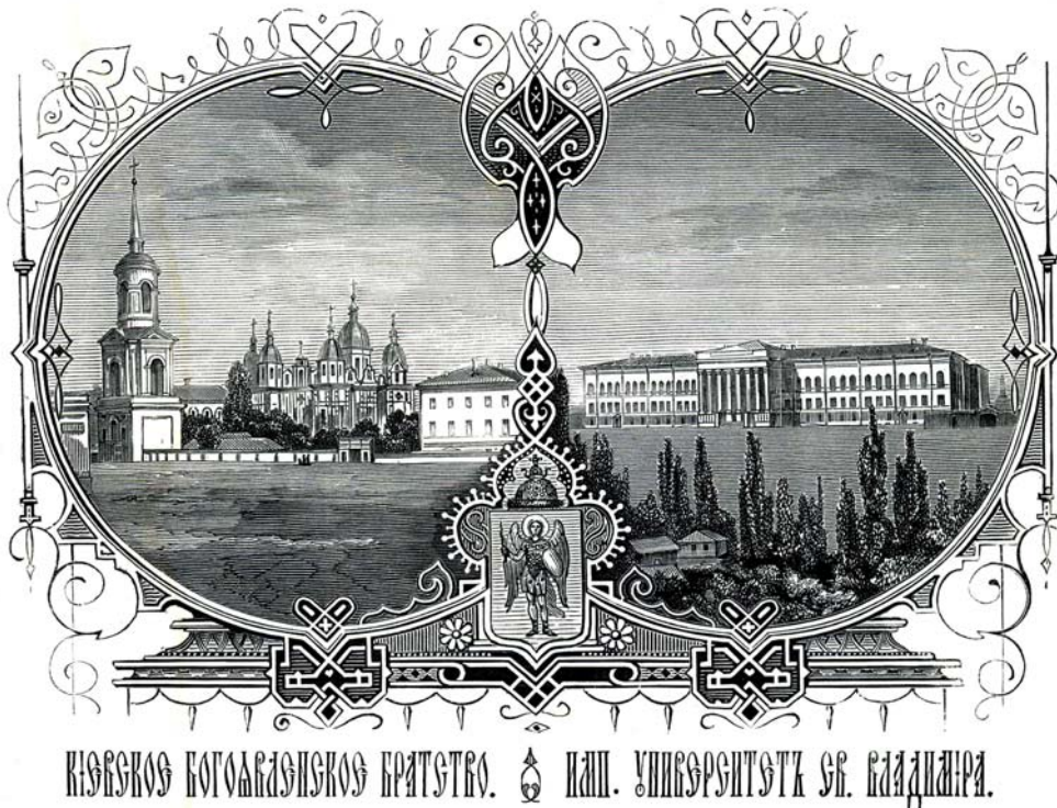
Гравюра из книги М. Максимовича (первого ректора Киевского университета Св. Владимира) «Письма о Киеве...», 1871 г.

В итоге, стремление правительства к централизации и к полному подчинению Украины привело в 1835 году к упразднению в Киеве Магдебургского права и отмене Литовского статута. Киевский герб с изображением архангела Михаила и имущество Магистрата были проданы, а городская артиллерия передана в Петербургский артиллерийский музей. Городская дума, занявшая место старого магистрата, была перенесена с Подола на новое место.