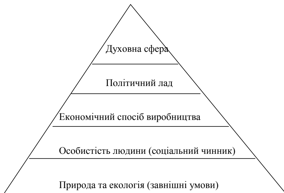
Рис. 1.2. «Піраміда» формування цивілізації.