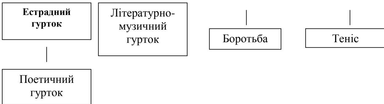
Рис. 1.2. Модель клубного об'єднання за місцем проживання

На етапі констатувального експерименту здійснено аналіз роботи клубних об'єднань і результатів опитування педагогів-організаторів; визначено найбільш помітні негативні прояви функціонування системи соціально-виховної роботи у клубних об'єднаннях, а саме: стандартний набір форм соціально-виховної роботи; помилки на етапі діагностики особистісних якостей підлітків; гіпертрофування словесних форм виховної роботи; сценарний підхід (що йде від педагога) до організації форм соціально-виховної роботи; відсутність системи індивідуалізації соціально-дозвіллевого виховання підлітків; зменшення ролі підлітків у вирішенні завдання організації змістовного дозвілля; формалізм в організації процесу соціально-виховної роботи тощо.