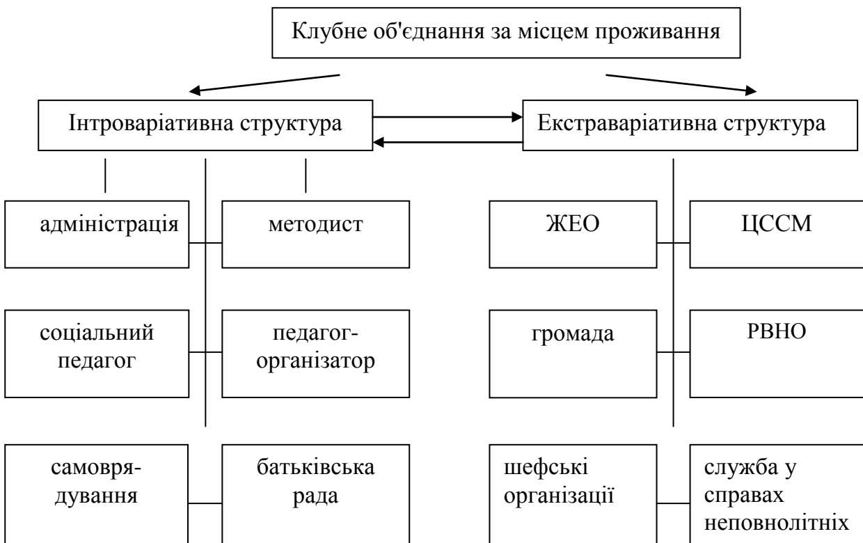
Рис.1.1 Інтраваріативна й екстроваріативна структура взаємозв'язків клубного об'єднання за місцем проживання

На основі класифікації клубних об'єднань (за цілями і напрямками діяльності; за масштабами діяльності; за ступенем організаційного оформлення діяльності) виокремлено принципи діяльності клубних об'єднань за місцем проживання (принцип гуманізації; принцип волі вибору; принцип самореалізації; принцип спільності діяльності; принцип інтересу; принцип систематичності і послідовності виховання; принцип виховання в колективі; принцип соціально-педагогічної захищеності) та загальні організаційні ознаки діяльності клубних об'єднань (добровільність; рівні права; гласність і відкритість; розвиток та підтримка ініціатив; співпраця дорослих та підлітків); визначено функції (ціннісно-орієнтаційну; інформаційно-аналітичну; прогностичну; комунікативну).