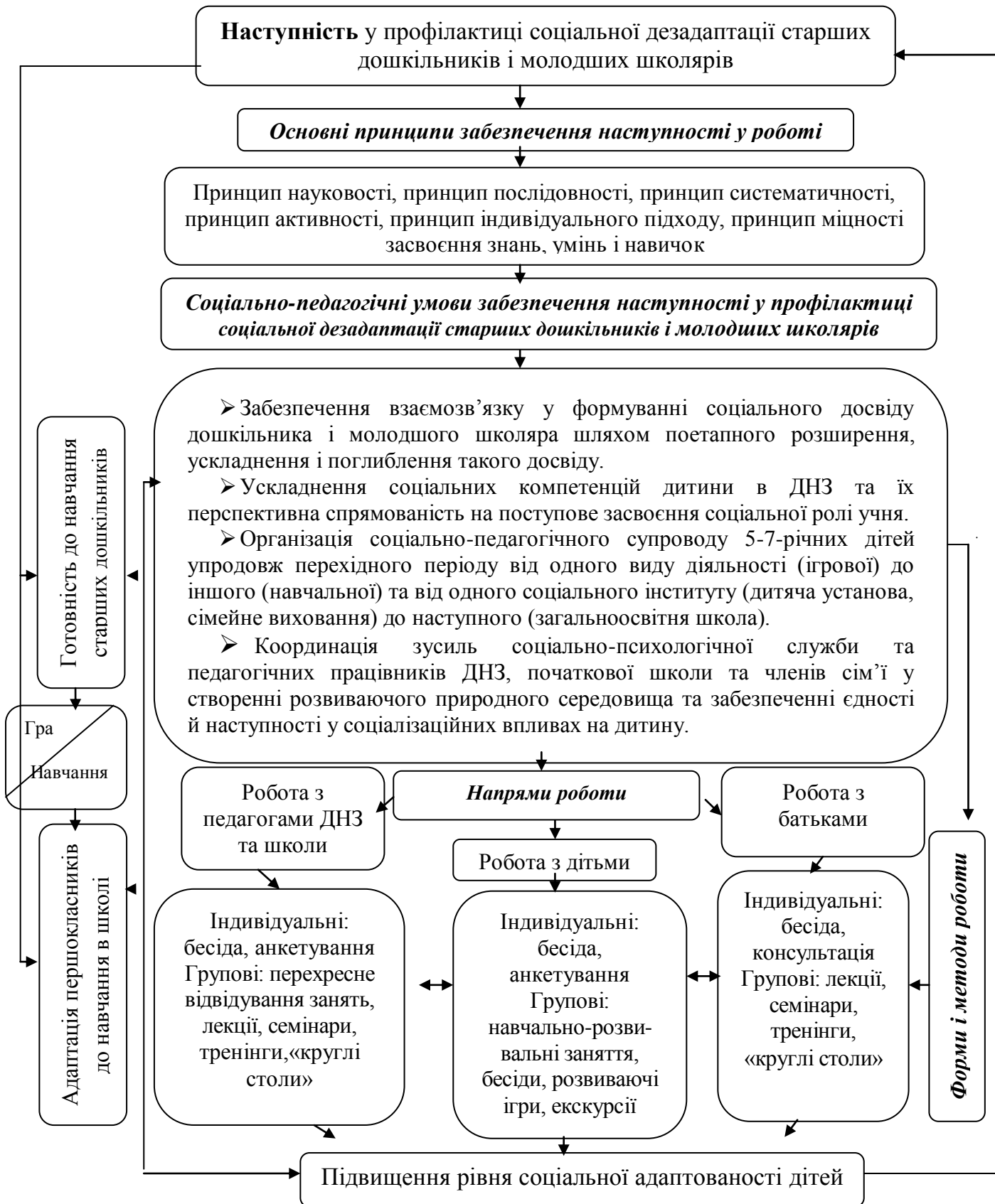
Рис. 1. Модель забезпечення наступності у профілактиці соціальної дезадаптації старших дошкільників і молодших школярів