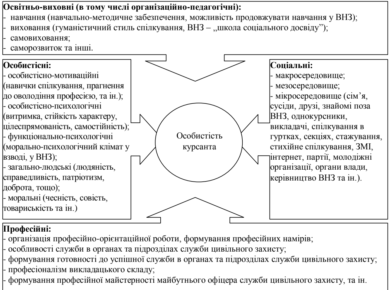
Рис. 2. Система факторів соціалізації курсантів ВНЗ МНС України

композиції соціальних навичок і моделей поведінки, соціальних ідей, цінностей і установок, спрямованих на реалізацію функціональних обов'язків у соціумі, нами визначено критерії, які дозволяють говорити про рівні соціалізованості курсантів (особистісна зрілість, соціальна зрілість, готовність до усвідомленого життєвого вибору, соціально-культурна активність).