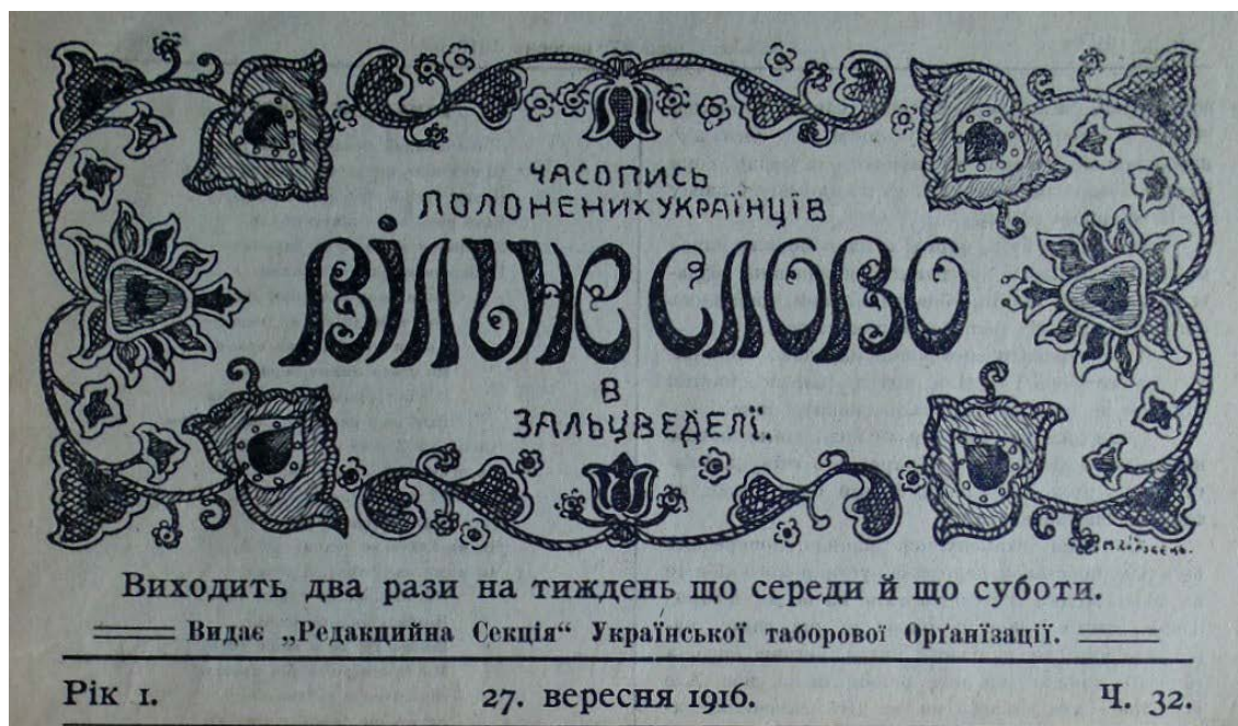
Рис. 2. Фрагмент титульної сторінки газети «Вільне Слово» з віньєткою (Ч.32 від 27 вересня 1916 р.), Зальцведель, Німеччина (Українська Бібліотека імені Симона Петлюри. Колекція періодики).

письменників, зокрема І. Франка, Г. Квітки-Основ'яненка, В. Винниченка, О. Стороженка, І. Нечуя-Левицького та ін. 26