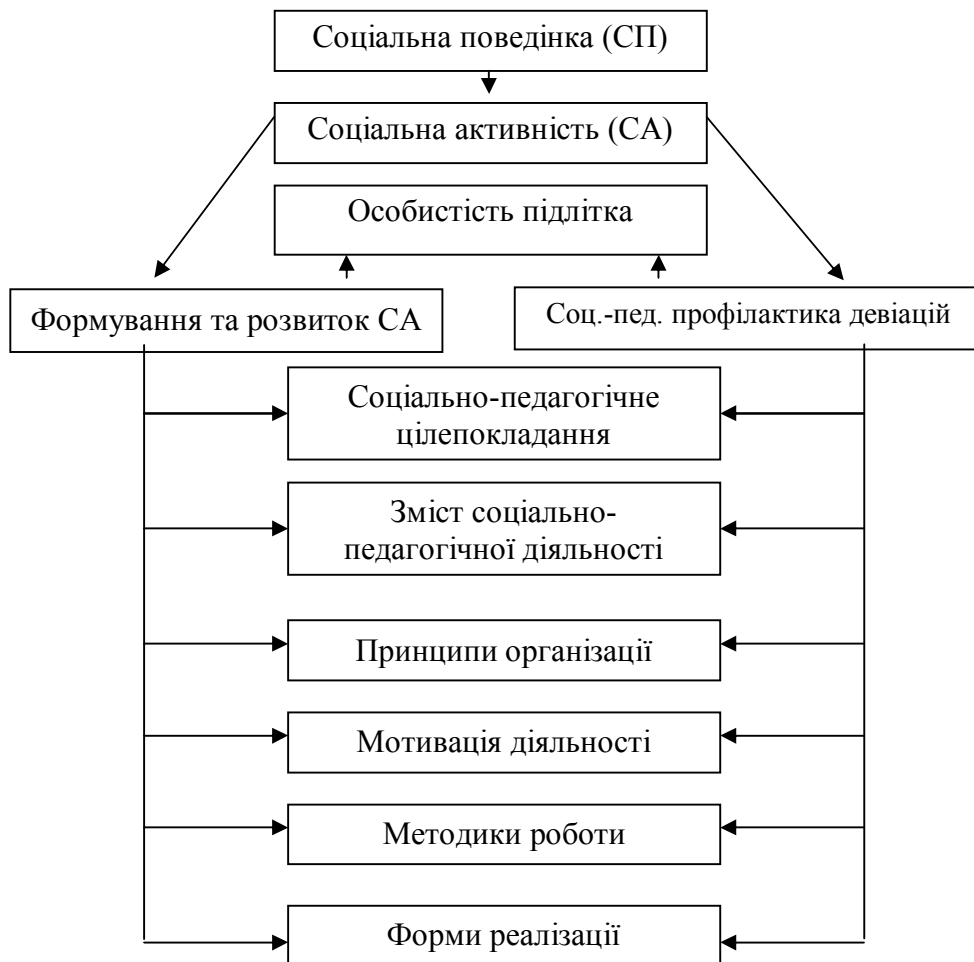
Рис. 2. Модель формування соціальної активності підлітка в основній школі

педагогічних технологій; удосконалення змісту позаурочної виховної роботи; гуманізації міжособистісних взаємин між учасниками навчально-виховного процесу та єдність вимог у вихованні; належній профорієнтаційній роботі з учнями в умовах школи і позаурочної діяльності; забезпечення взаємозв'язку цілеспрямованого виховання із самовихованням.