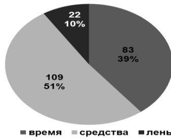
Рисунок 2 – Причины расхождения между фактическим и желаемым состоянием по категории «спорт и физическая активность» (в абс. вел. и % от числа выборов).