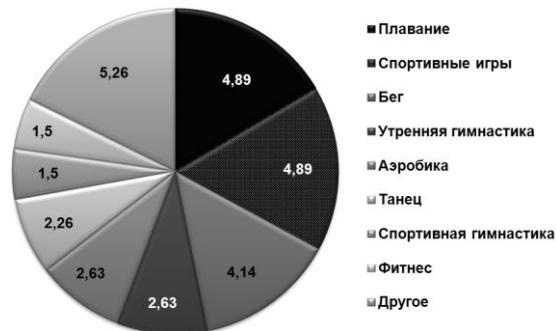
Рисунок 4 – Долевое соотношение участия испытуемых в разных видах спорта и физической активности в % от общего числа респондентов.

Здесь же мы уже видим, картина меняется, доминирующей причиной несовпадения выступает категория «нехватка средств» – упоминается 109 раз (51%), затем следует вторая причина – «нехватка времени», упоминается 83 раза (39%), и минимальное число упоминаний – 22 раз (10%) приходится на категорию «лень». По всей видимости, такое распределение данных обусловлено тем, что студенты связывают туризм с определенными экономическими затратами. Того требует выездной туризм и экскурсии. Естественно, определенных экономических затрат требует и спортивный туризм (покупка снаряжения, спортивной формы и т.д.), и массовый любительский туризм, что не всегда могут позволить себе студенты. Результаты показывают, что 50,38% от общего числа респондентов указали, что занимаются спортом и физической культурой, при этом, 25,19% от общего числа респондентов учатся на специализациях связанных с физической воспитанием. Можем предположить, таким образом, что около 25% респондентов других специализаций, не связанных с физической культурой, занимаются ей самостоятельно. На рисунке 5 представлены данные по спортивно-оздоровительным предпочтениям физически активных студентов. Данные о предпочтениях студентов в сфере физической активности и оздоровительного спорта представлены на Рисунке 4.