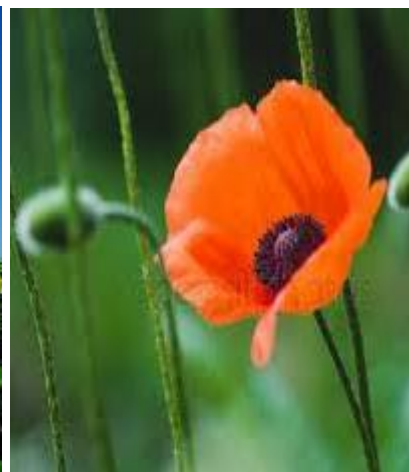
Fig. 17. Poppy.