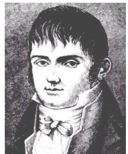
Fig. 4. Floral dictionary (1858). Fig. 5. The Language of Flowers . Fig. 6. C. S. Rafinesque.

William Shakespeare, Jane Austen, Charlotte and Emily Bronte, children's novelist Frances Hodgson Burnett, Joanna Rowling, Chuck Palahniuk, among others, used the language of flowers in their writings.