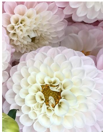
Fig. 8. Dahlia.