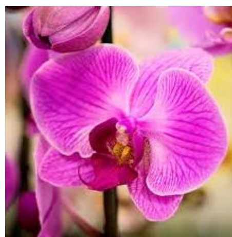
Fig. 12. Orchid.

Flowers of Joe , e.g. Lily of the Valley (fig. 13). This delicate flower represents sweetness and purity and has appeared in the royal wedding bouquets of Kate Middleton (The Duchess of Cambridge, fig. 14). Lily of the Valley symbolizes the return of happiness ( http://weddings.bestblooms.co.nz/popularweddingflowers.html ).