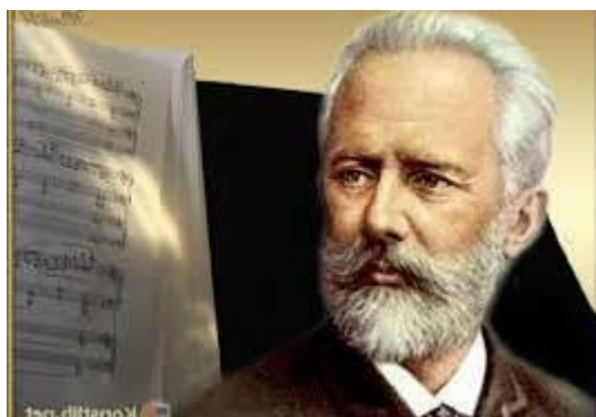
Fig. 20. Pyotr Tchaikovsky.