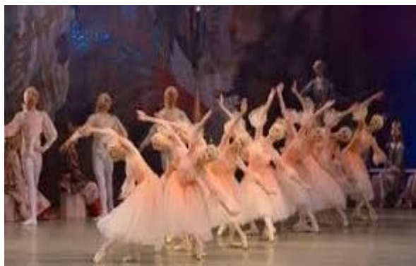
Fig. 19. "Waltz of the Flowers".

And, finally, we have to remember the brilliant music "Waltz of the Flowers"(fig. 19) from Ballet "Nutcracker" by P. I Tchaikovsky's (fig. 20) [24; 25].