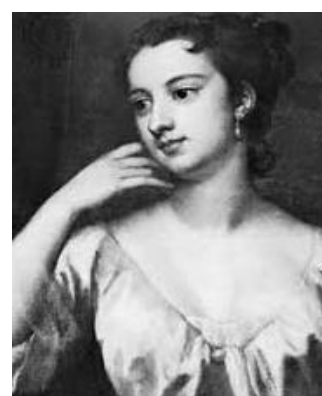
Fig. 1. W. Shakespeare. Fig. 2. Travels by Aubry de La Mottraye. Fig. 3. Mary Wotley Montagu.