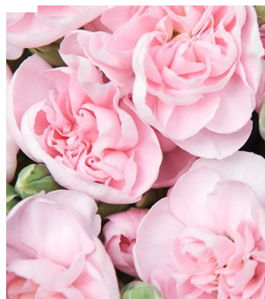
Fig. 9. Carnation.

There are flowers of admiration, e.g. Sweet William (fig. 10). As one of the only flowers to symbolise masculinity, Sweet William means gallantry. Historically, William Sweet was mentioned in romantic ballads as a noble, lovelorn hero, so give these to your knight in shining armour. The general meaning of these flowers is love, affection and admiration. Go for white to show adoration and pink to show longing (often given to someone who is missed).