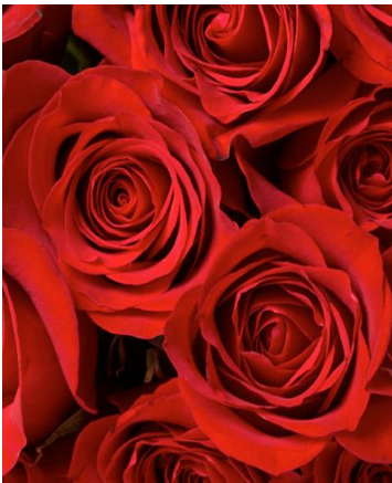
Fig. 7. Red Rose.