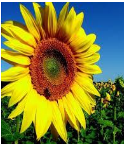
Fig. 16. Sunflower.

Sunflower (fig. 16). How can the big, cheerful heads of the sunflower mean anything but happiness? There are over 80 species of sunflower, ranging in colour from bright and pale yellow to orange, pink and tawny red. The sunflower has many meanings across the world. Different cultures believe it means anything from positivity and strength to admiration and loyalty. In Chinese culture, sunflowers are said to mean good luck and lasting happiness which is why they are often given at graduations and at the start of a new business. The ancient Greeks believed that sunflowers turned towards the sun because of the nymph Clytie's adoration of Apollo, the God of the Sun. The scientific name for the sunflower is Helianthus . It comes from the Greek words " helios ", meaning sun, and " anthus ", meaning flower. The sunflower is the national flower of Ukraine ( https://www.interflora.co.uk/content/sunflowers/ ).