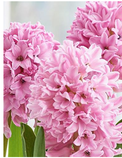
Fig. 13. Lily of the Valley. Fig. 14. Kate Middleton. Fig. 15. Pink Hyacinth.

Pink Hyacinth: the pink blooms of the hyacinth symbolise playfulness [17].