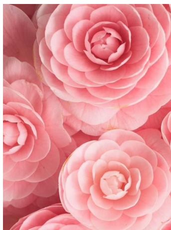
Fig. 11. Camellia.