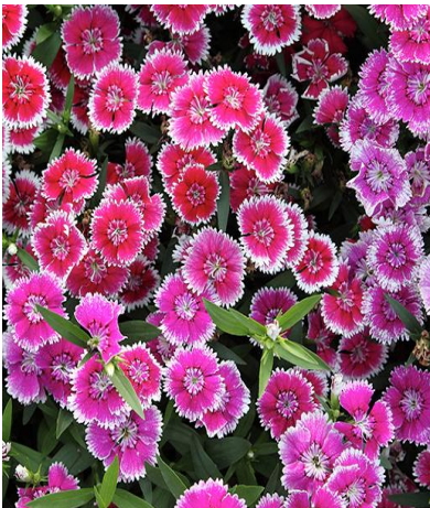
Fig. 10. Sweet William

Orchid (fig. 12). These highly distinctive flowers symbolise rare and delicate beauty . Interestingly, they were favoured by the Ancient Greeks to show masculinity but this has now changed to a more feminine meaning [17].