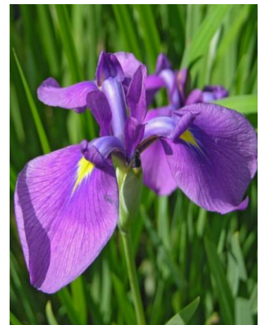
Fig. 18. Iris.

We present other flowers and their meanings, e.g. Poppy . This is one of the most well known flower meanings because we buy paper ones each year for Remembrance Day. They symbolise remembrance and consolation.