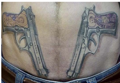
Фото 3. Татуировка оружия

С самого детства люди «нагружаются» негативными чувствами, которые потом воспринимают как сущность «Я». Наличие эдипальной зависимости находит выражение в блокировке и разрушении чувственных отношений с объектами либидо, что впоследствии может экстраполироваться на взаимоотношения с окружающими людьми и осложнять общение. Анализ процесса татуирования и отношения субъекта к собственному телу, указывает на возможность превращать себя в предмет, омертвляющего свои чувства ради достижения превосходства над окружающими. Последнее находит выражение и в сюжетах психорисунков, где протагонисты утверждают, что могут наказывать себя, разрушать предметы окружающего мира, омертвлять свои чувства и чувства других людей, тенденции «к психологической смерти» и «к психологической импотенции». В сюжетах тату проявляется агрессия в виде угрожающих рисунков, оружия (фото 3), диких зверей, пугающих иллюстраций (фото 4), порезов, когтей и т. д. Познание этих тенденций осуществленное посредством АСПО свидетельствует о том, что татуировки являются одной из форм аутоагрессии.