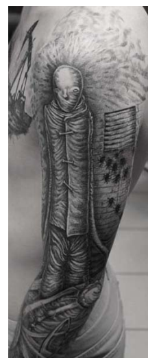
Фото 2. Тату забинтовано-го человека

Работая с татуированным респондентом, необходимо также использовать и другие косвенные средства познания. Диагностико-коррекционная работа с иллюстрациями тату дополняется также неавторскими рисунками, психорисунками. Метод АСПО предполагает синтез используемых в его рамках методик, особенно