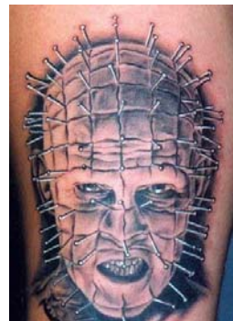
Фото 4. Тату «Человек с забитыми в голову гвоздями»

Анализ иллюстраций татуировок участниками группы АСПО свидетельствует о разнообразии поведенческих проявлений агрессивного характера и маскировке их диаметрально противоположными тенденциями. Выбор иллюстрации татуировки «высекает» определенный спектр самовосприятия в контексте выявления агрессии и в значительной степени помогает субъекту построить рассказ о себе [5]. Символика татуировок порождает у каждого субъекта индивидуально-неповторимые ассоциации, которые катализируют осознание причин внутренней противоречивости психики и собственной агрессивности.