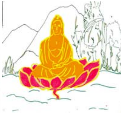
Рис. 2. Мета мого життя