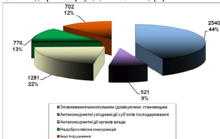
Рис. 1. Структура порушень законодавства про захист економічної конкуренції, припинених АМКУ у 2012 році

Особливо загрозовою з точки зору забезпечення економічної безпеки така статистика видається через те, що найбільшу кількість порушень законодавства про захист економічної конкуренції було виявлено на найбільш значущих для стабільного соціально – економічного розвитку ринках житлово-комунального господарства (15,33 відсотка всіх порушень), агропромислового комплексу (14,41 відсотка), адміністративних послуг (10,73 відсотка), паливно-енергетичного комплексу (7,74 відсотка), охорони здоров'я (6,96 відсотка), будівництва та будівельних матеріалів (4,21 відсотка), транспорту (3,71 відсотка) [1].